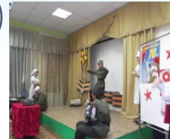
Праздники в школе