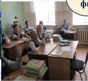
Все обо всем (развивающая игра)