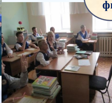
Все обо всем (развивающая игра)