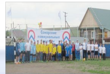
Встречи по мини футболу