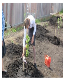
Разбиваем фруктовый сад выпускников

потребность в занятиях физ.культурой и спортом