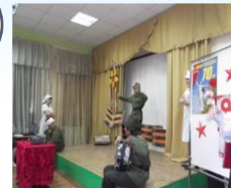
Праздники в школе