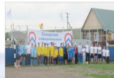
Встречи по мини футболу