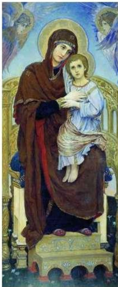
В. Васнецов. Богоматерь с младенцем