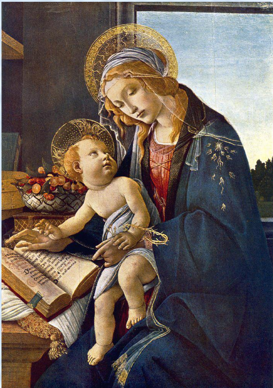
Рафаэль Санти «Малая мадонна»