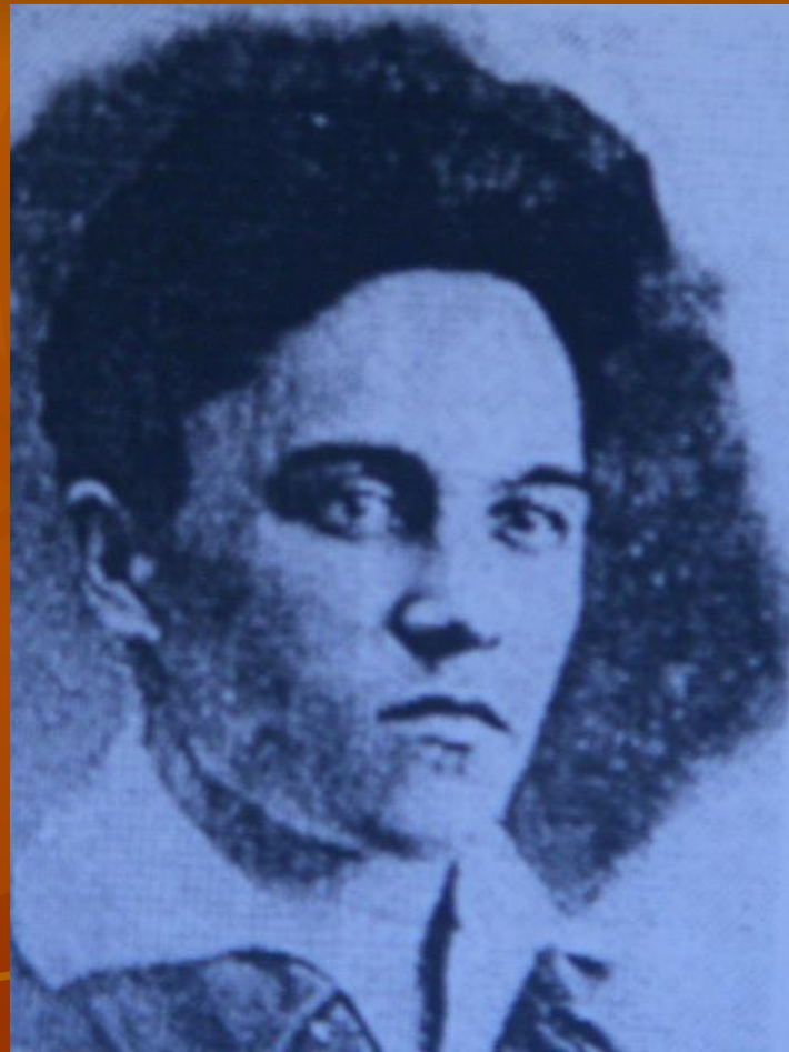
Шадт Булат (1909 – 1943)