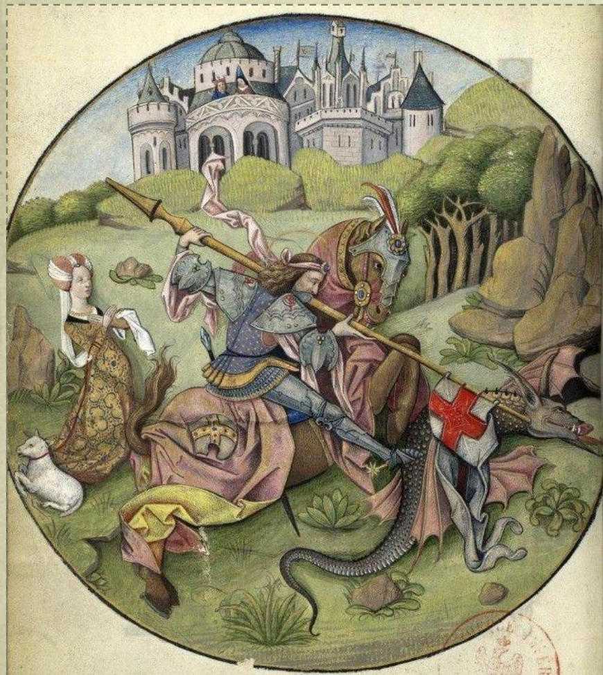
Хроника XIII в.