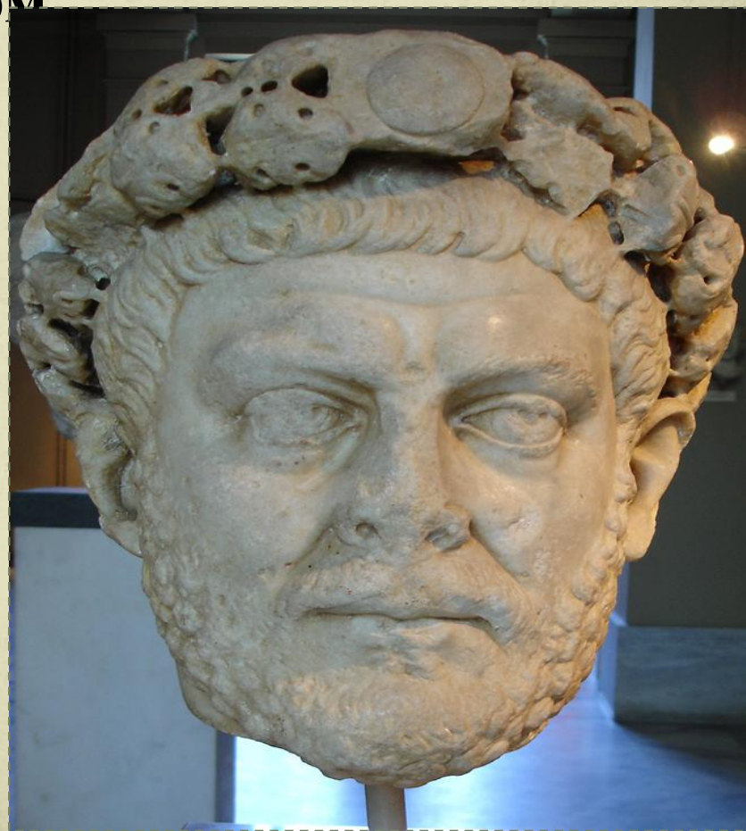
Диоклетиан 284 – 305 гг.