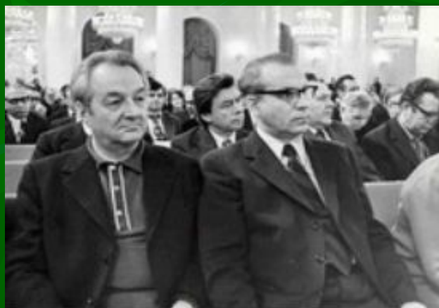
Сладков и Бианки на съезде писателей