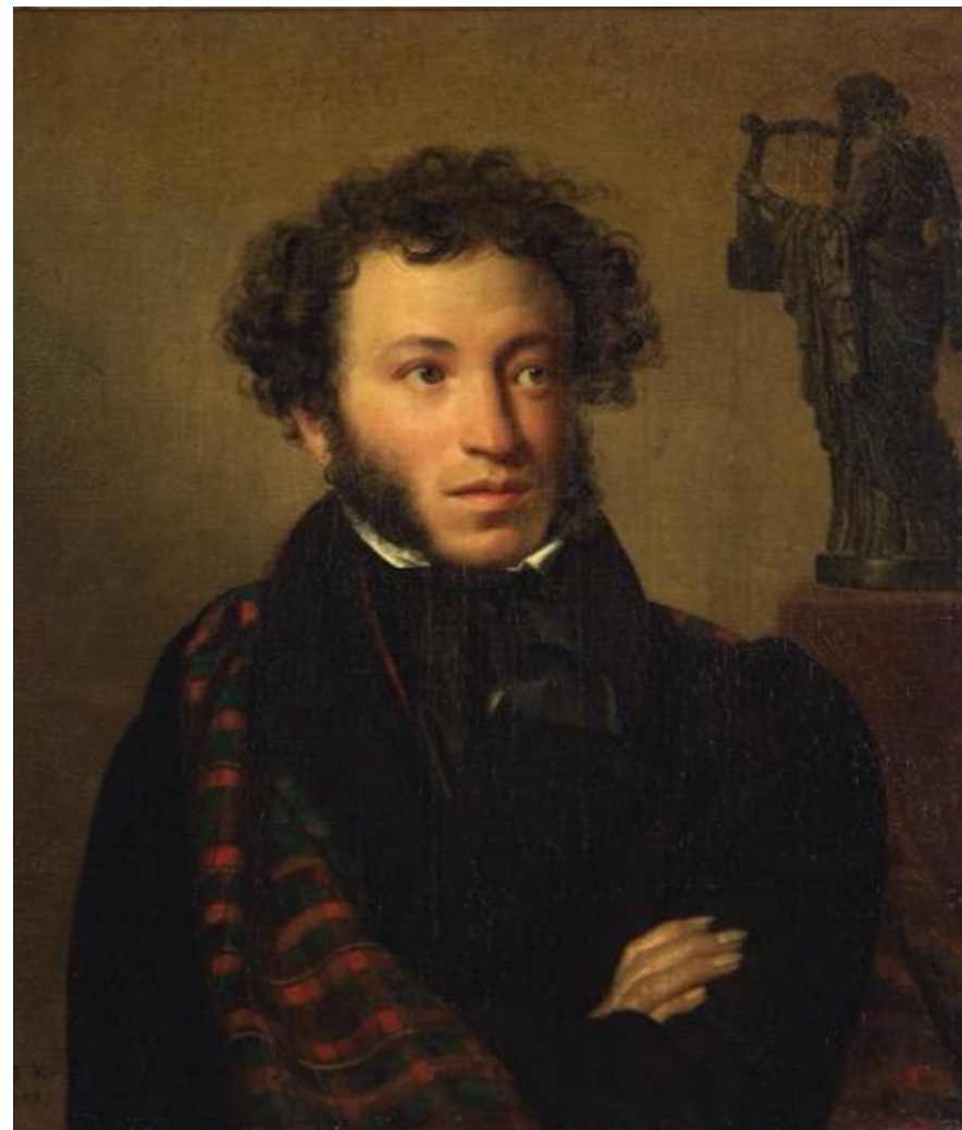
Орест Адамович Кипренский. «Портрет А.С.Пушкина»