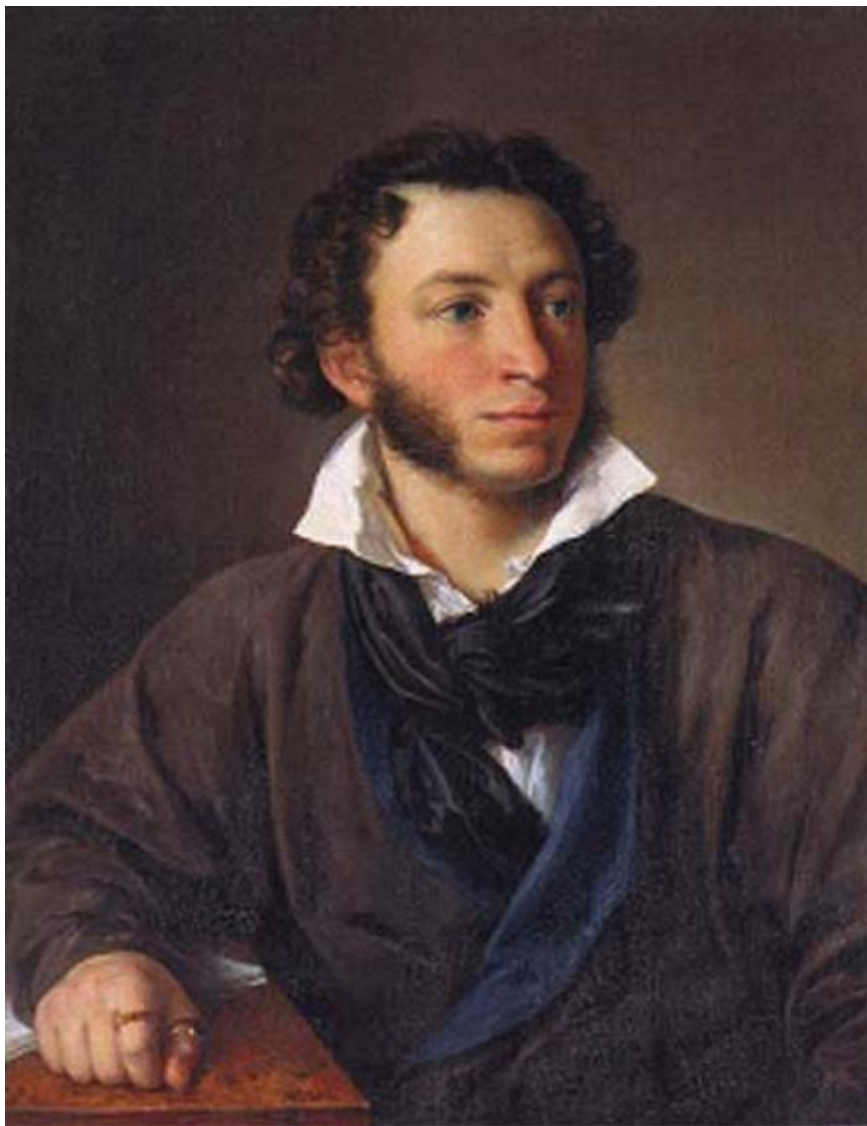
Василий Андреевич Тропинин. «Портрет А.С.Пушкина»