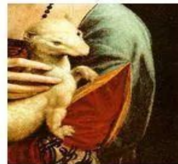
«Дама с горностаем»