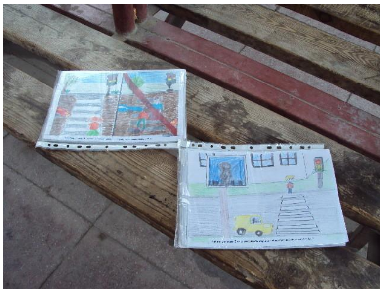
МАОУ СОШ № 7 г. Сухой Лог