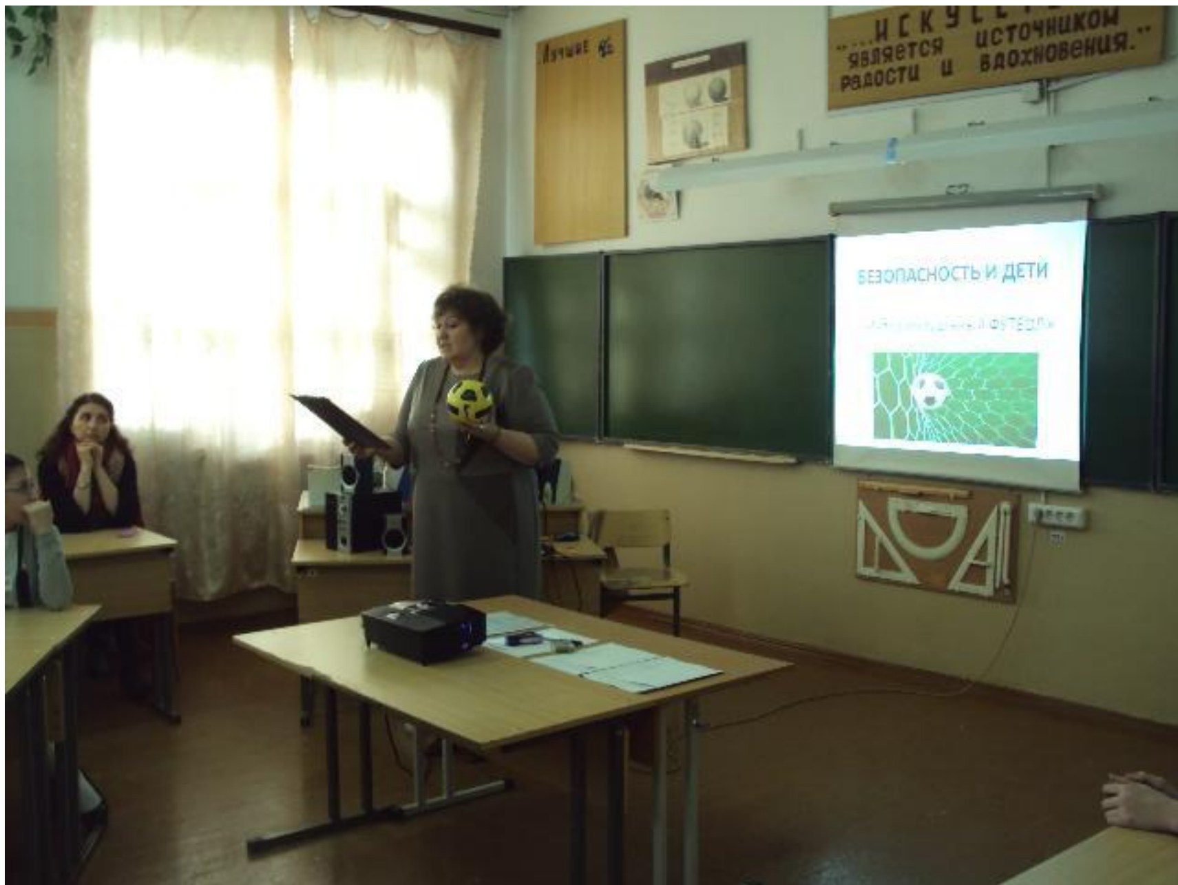
МАОУ СОШ № 7 г. Сухой Лог