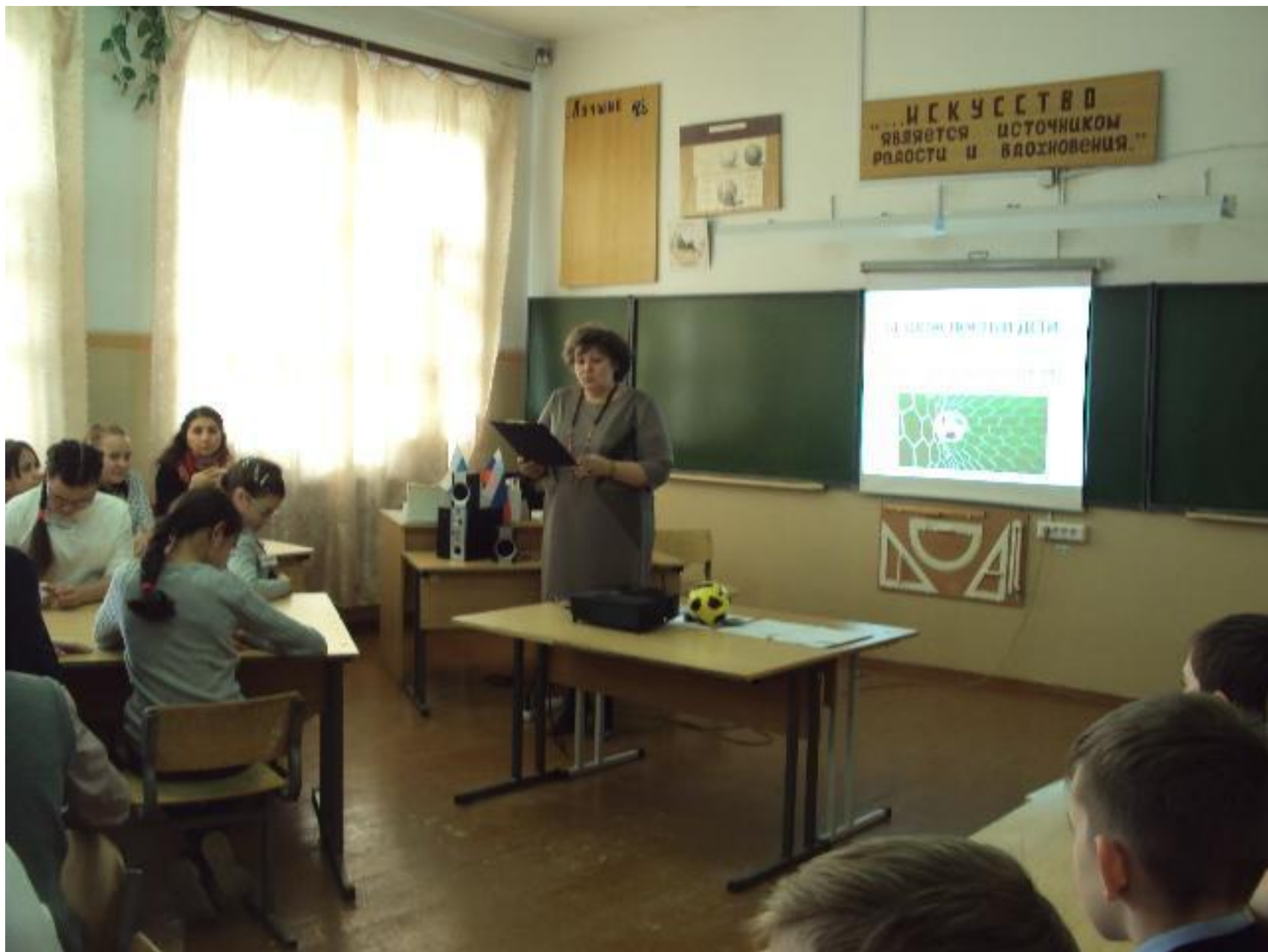
МАОУ СОШ № 7 г. Сухой Лог