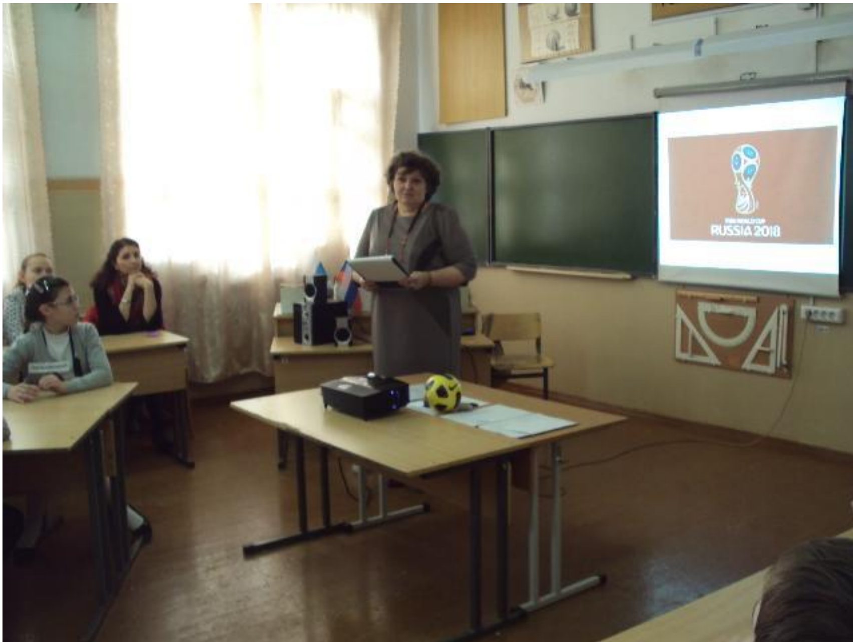
МАОУ СОШ № 7 г. Сухой Лог