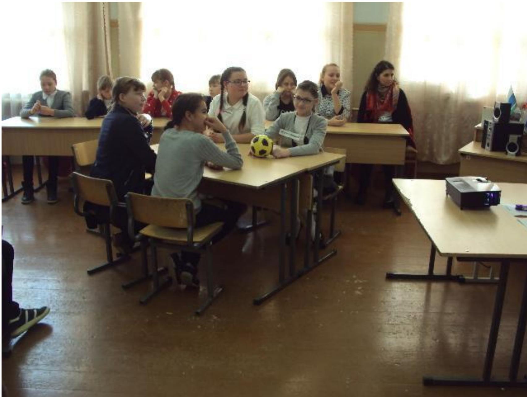
МАОУ СОШ № 7 г. Сухой Лог