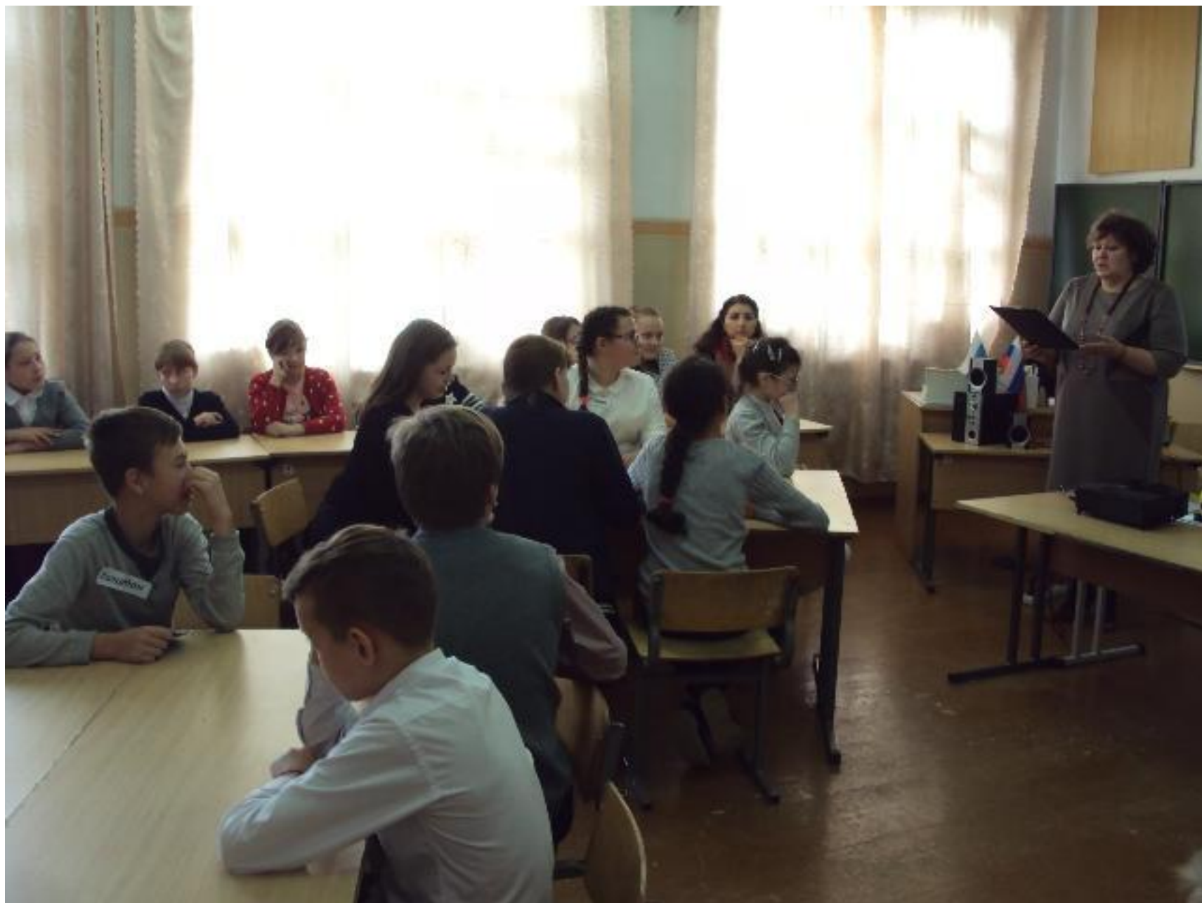
МАОУ СОШ № 7 г. Сухой Лог