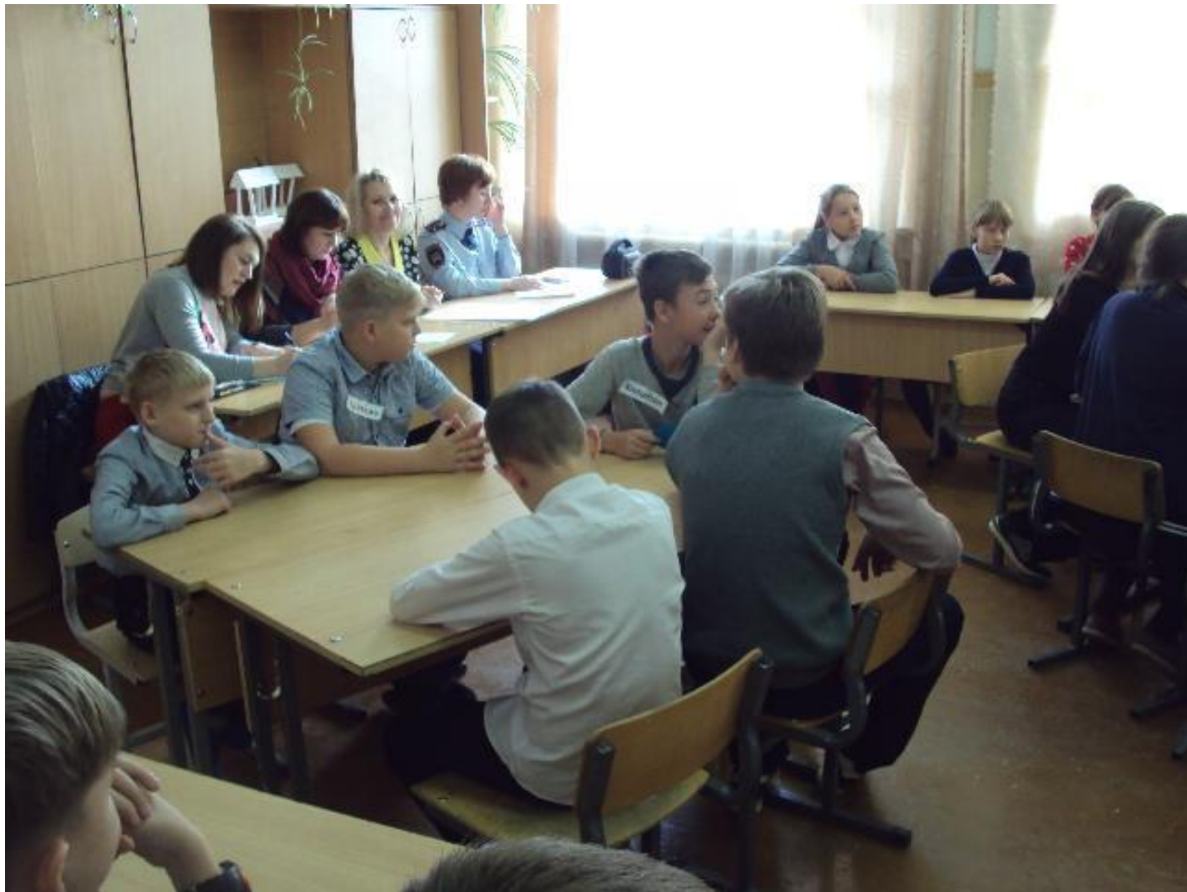
МАОУ СОШ № 7 г. Сухой Лог