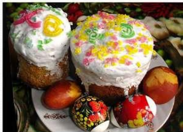
Куличи и пасхальные яйца