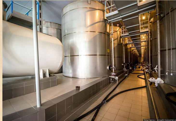
Процесс дистилляции коньяка