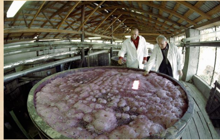
Сбраживание выдавленного сока