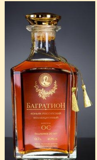
Коньяк очень старый