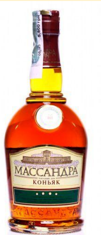
Коньяк «4 звездочки»