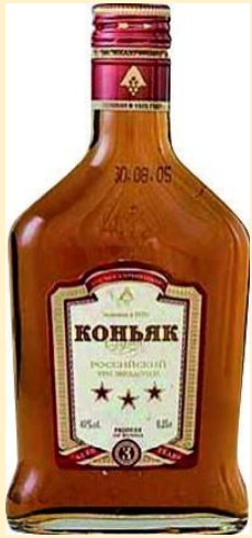
коньяк с выдержкой 3 года