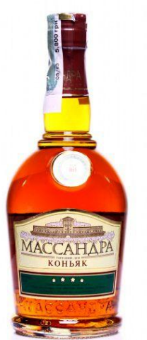
Коньяк «4 звездочки»