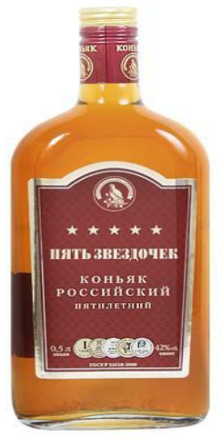
Коньяк 5 звездочный