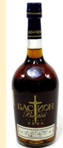
Коньяк выдержанный высшего качества