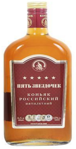
Коньяк 5 звездочный