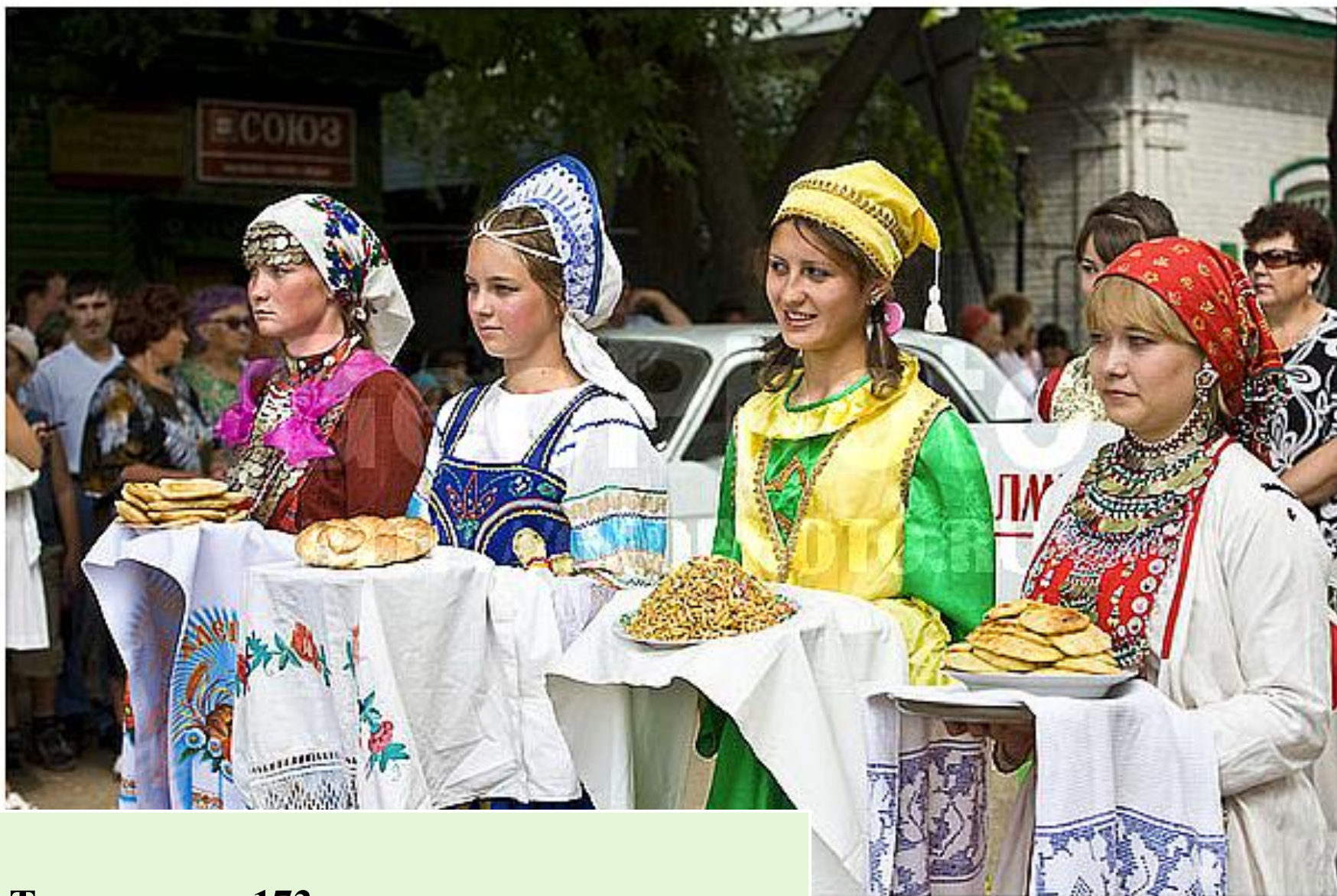
Татарстанда 173 милләт вәкиле яши