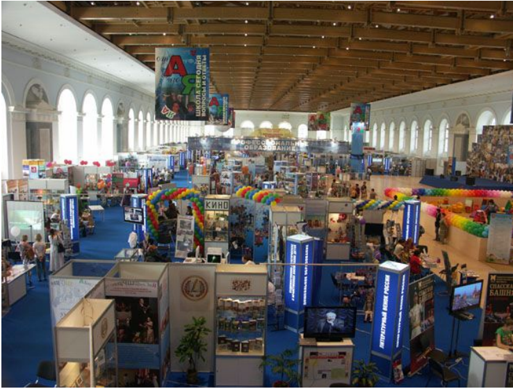
Ярмарка школьно- письменных принадлежностей.