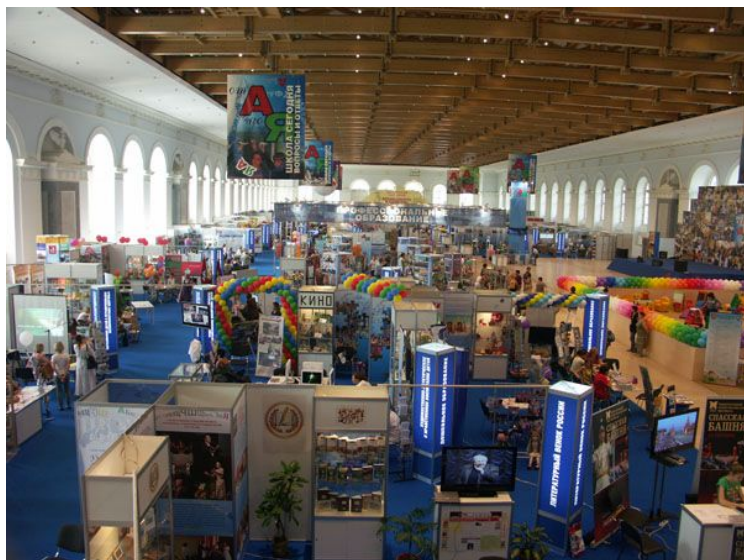
Ярмарка школьно- письменных принадлежностей.