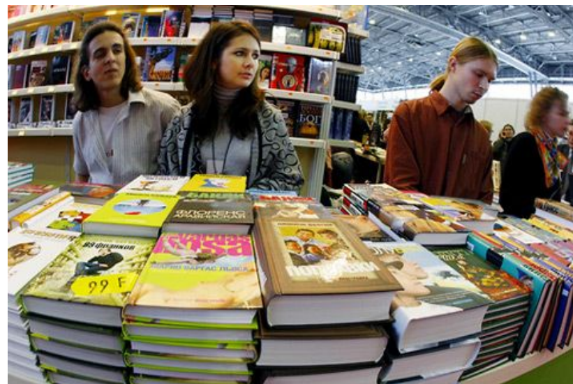
Ярмарка продажи книг, одежды и т. д.