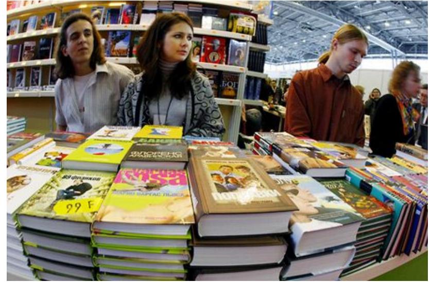
Ярмарка продажи книг, одежды и т. д.