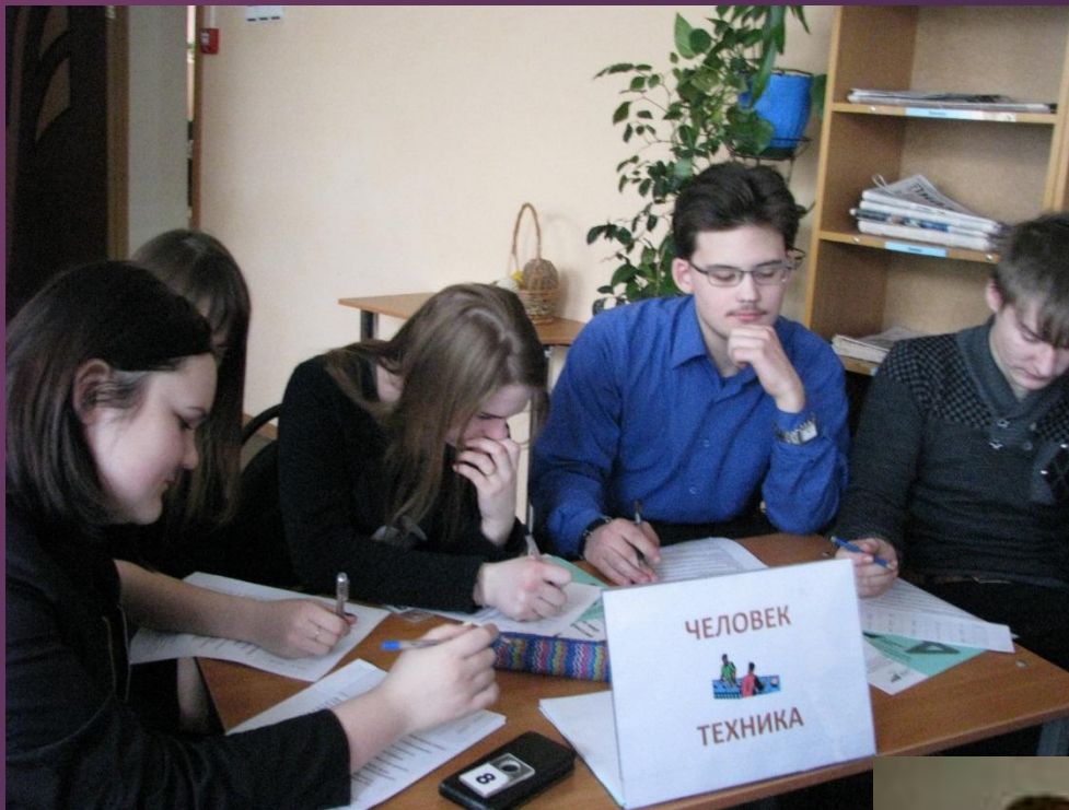
Работа групп « человек – техника» и « человек-природа»