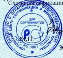
Схема сертификации 3.