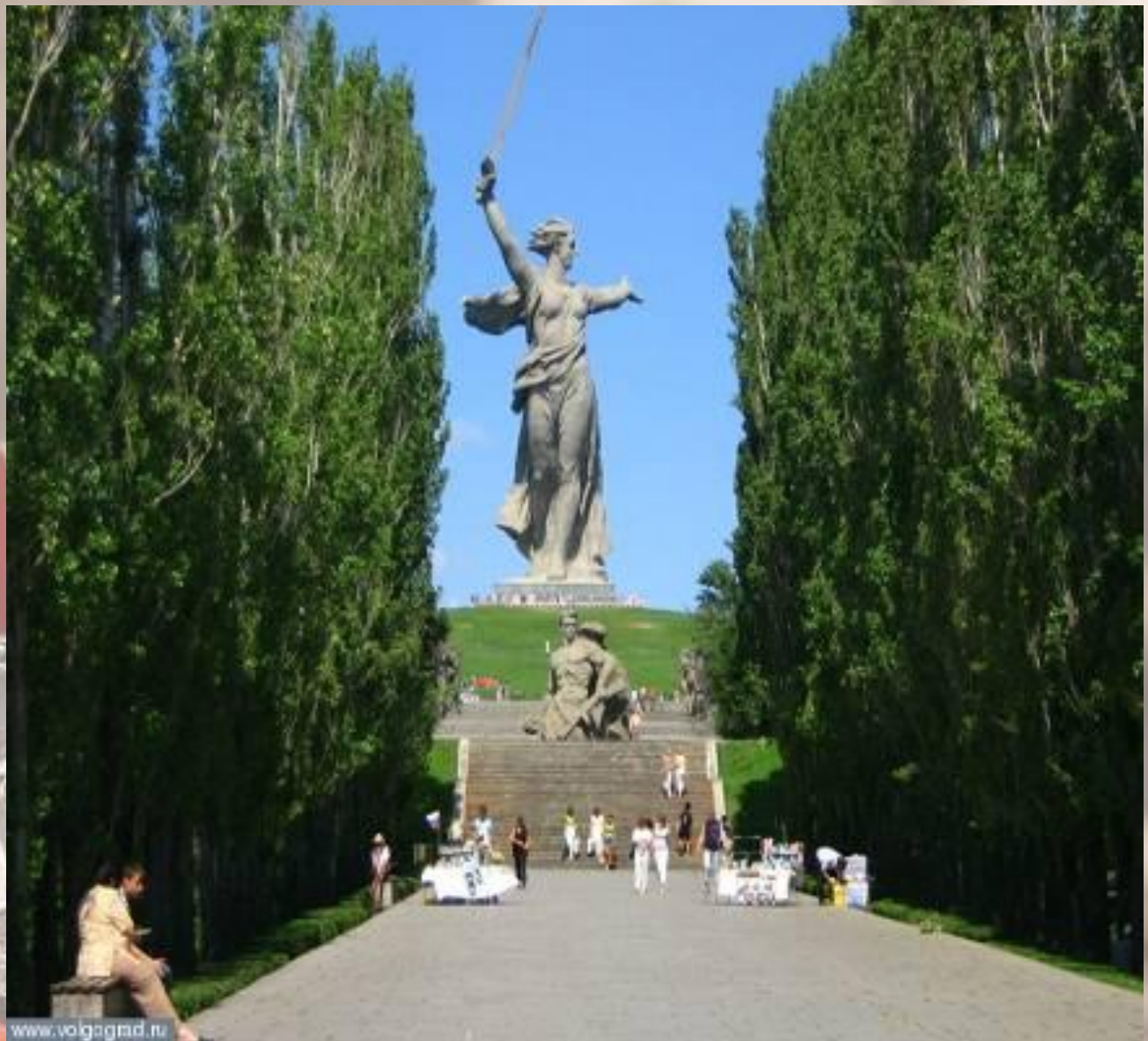
Мемориальный комплекс на Мамаевом кургане