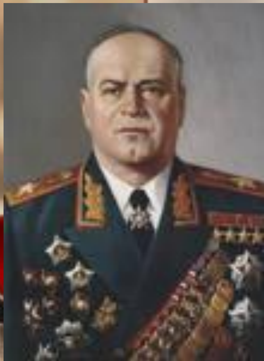
ЖУКОВ Георгий Константинович