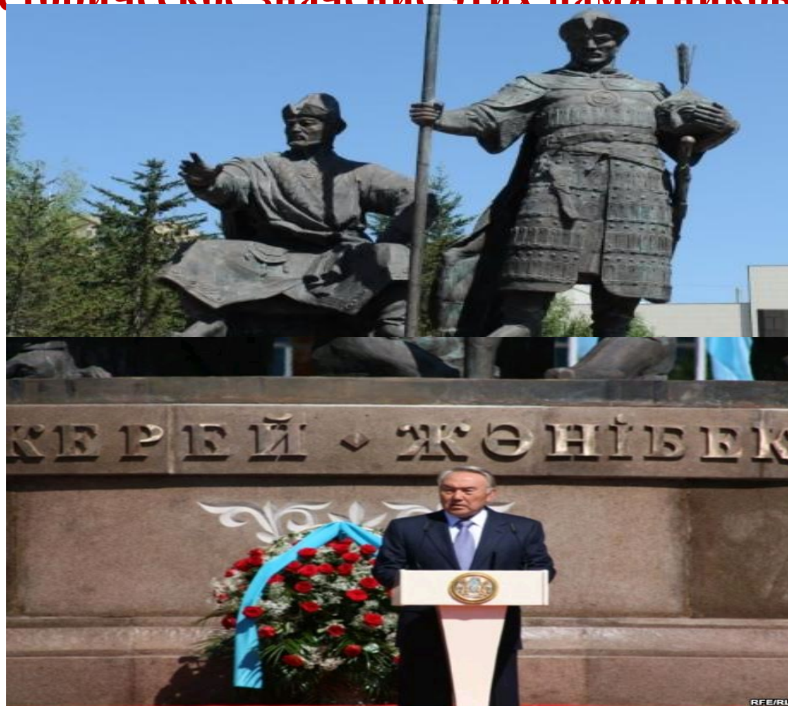
Памятник Керей и Жанибек-хан. АСТАНА, 1 июня 2010 г.