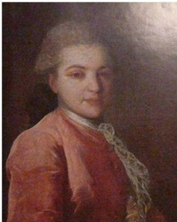
Портрет И.И. Воронцова 1770 г.

Фёдор Степанович Рокотов (1735 – 1808) – художник – портретист. В его работах привлекает красота внутреннего мира человека.