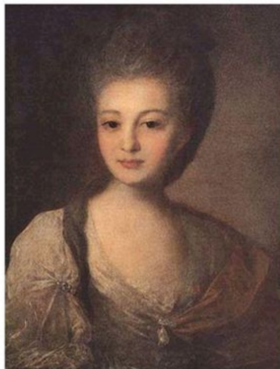
Портрет А.П. Струйской 1772 г.