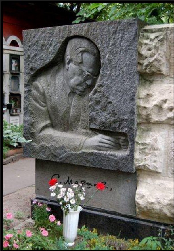
Памятник на могиле С.Я. Маршака