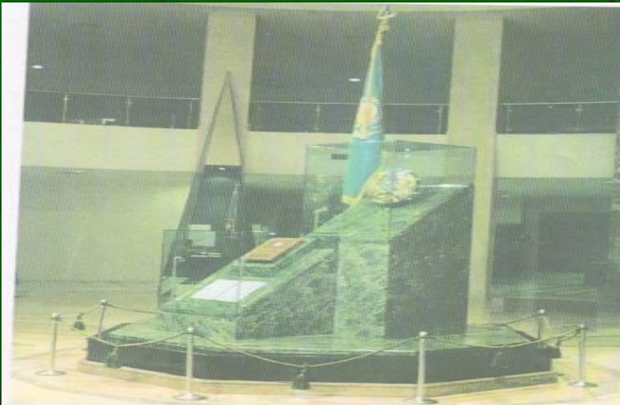
Еліміздің Туы. Елтаңбасы. Әнұраны. Конституциясы қойылған орын. ҚР Президенттік мәдениет орталығы.

1992 жылы 4-маусымда жаңа мемлекеттік рәміздер: Елтаңба, Ту, Әнұраны бекітілді.