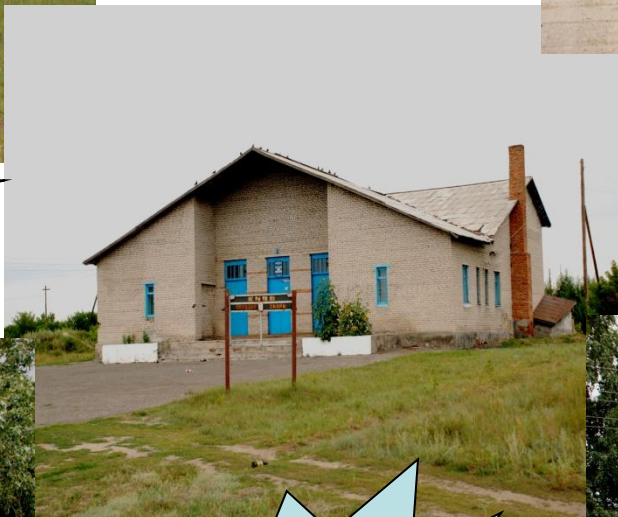
Дом Культур ы