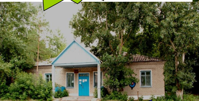
Сельская администра ция