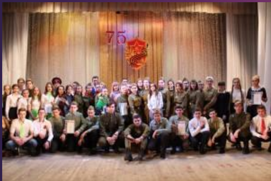
Конкурс литературно-музыкальных композиций «Не гаснет памяти огонь»

Ключевыми целями данной системы считаются становление у подрастающего поколения гражданственности и патриотизма как наиглавнейших духовно-нравственных и общественных ценностей, составление у молодежи мастерски важных свойств, умений и готовности к их функциональному проявлению в всевозможных сферах жизни общества.