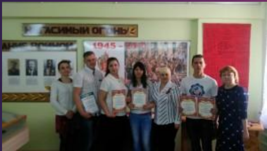
Областной молодежный патриотический фестиваль «И снова май, салют, Победа!»

На протяжении всего образовательного периода в нашем техникуме студенты вовлечены в процесс патриотического воспитания через привлечение к участию в различных конкурсах и мероприятиях, так например, в конкурсах презентаций. Безусловно, воспитание личности - патриота в студенческий период осуществляется в течение всего учебно-воспитательного процесса: и во время учебной деятельности (в рамках изучения дисциплин) и во внеклассной деятельности.