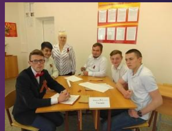
Историческая викторина «Горжусь Россией»