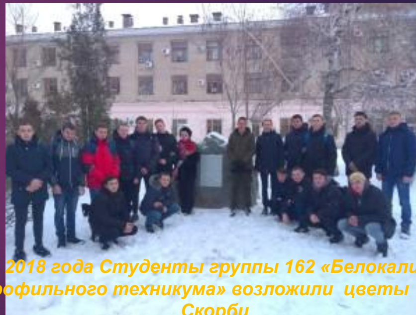
19 января 2018 года Студенты группы 162 «Белокалитвинского многопрофильного техникума» возложили цветы к «Камню Скорби»