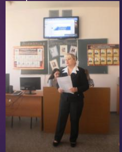
Викторина «Горжусь Россией»