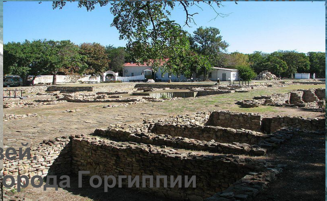
Археологический музей. Раскопки античного города Горгиппии