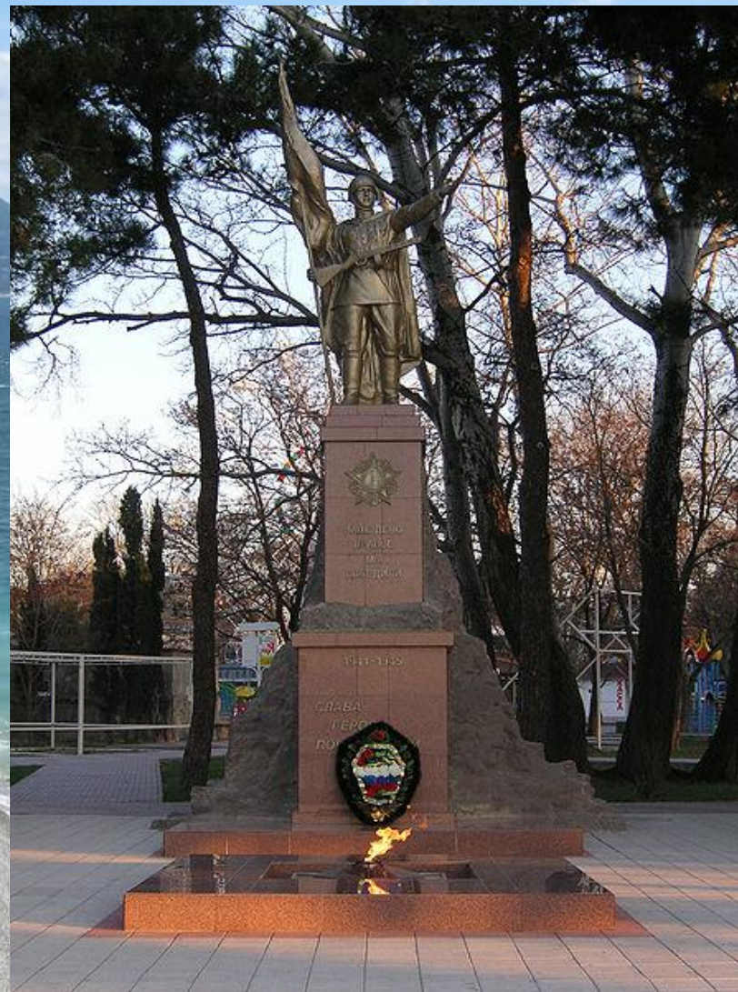
Памятник героям- победителям в Геленджике