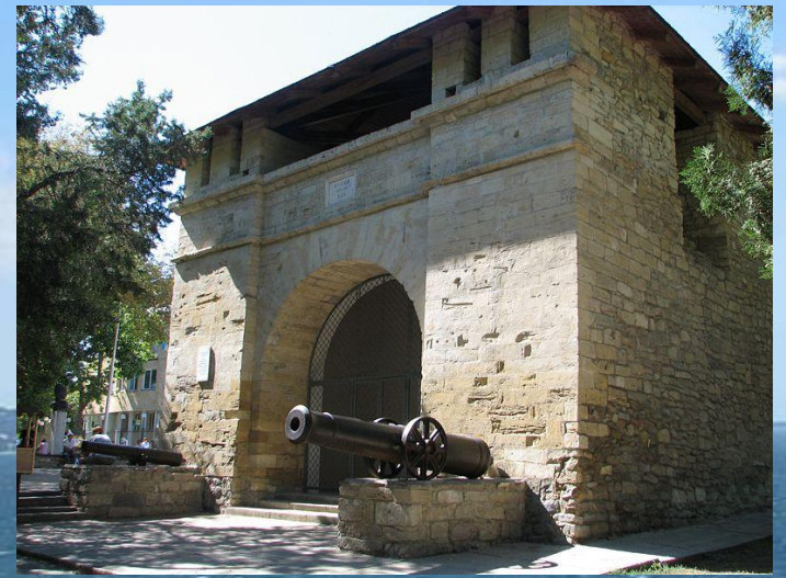
Русские ворота — остатки турецкой крепости, построенной в 1783 году