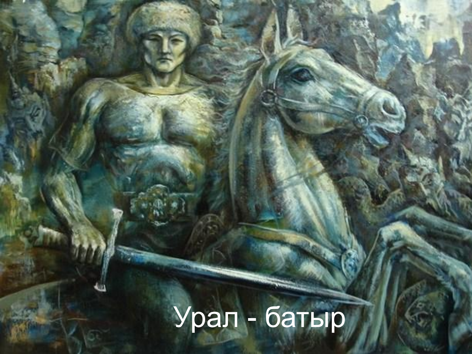
Урал - батыр