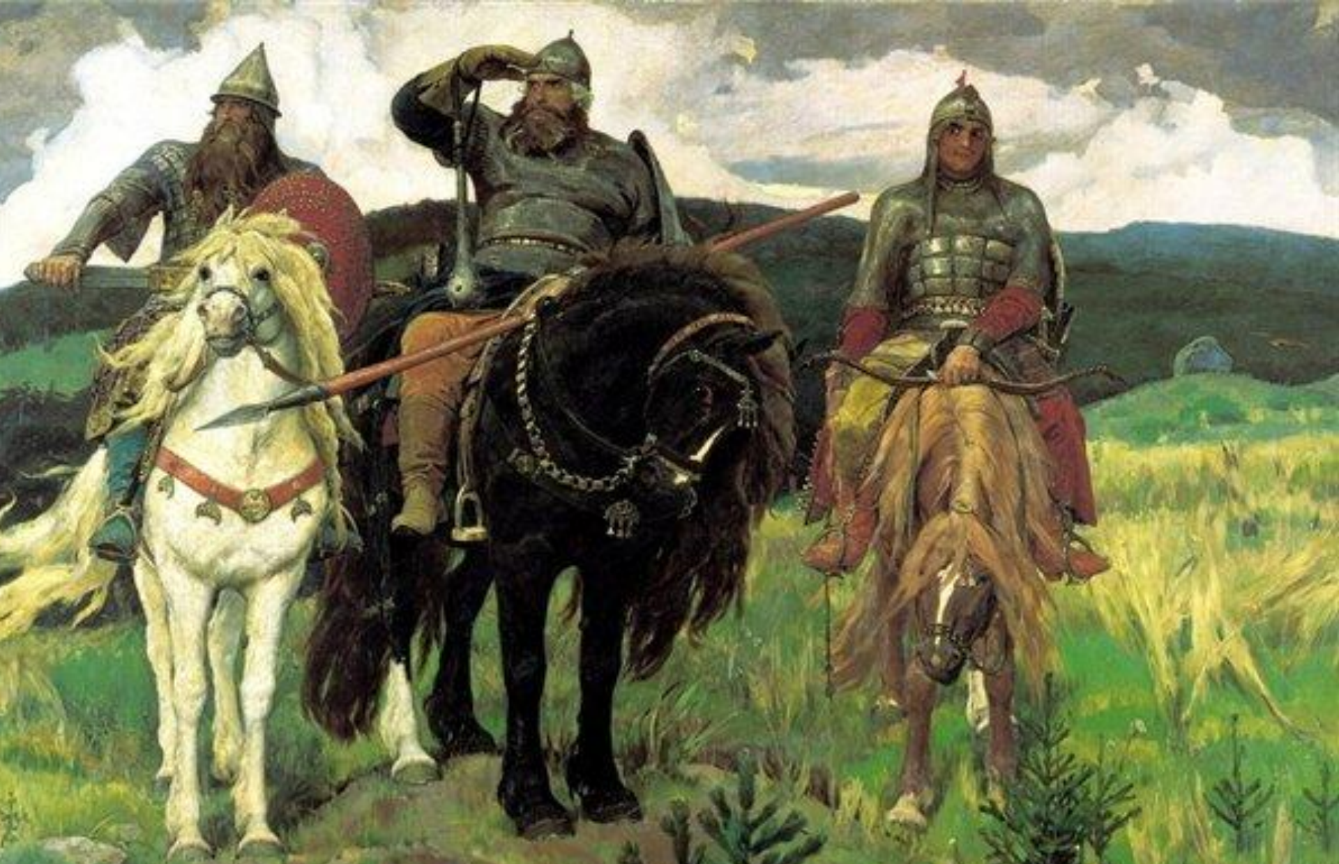
«Богатыри» В.М. Васнецов