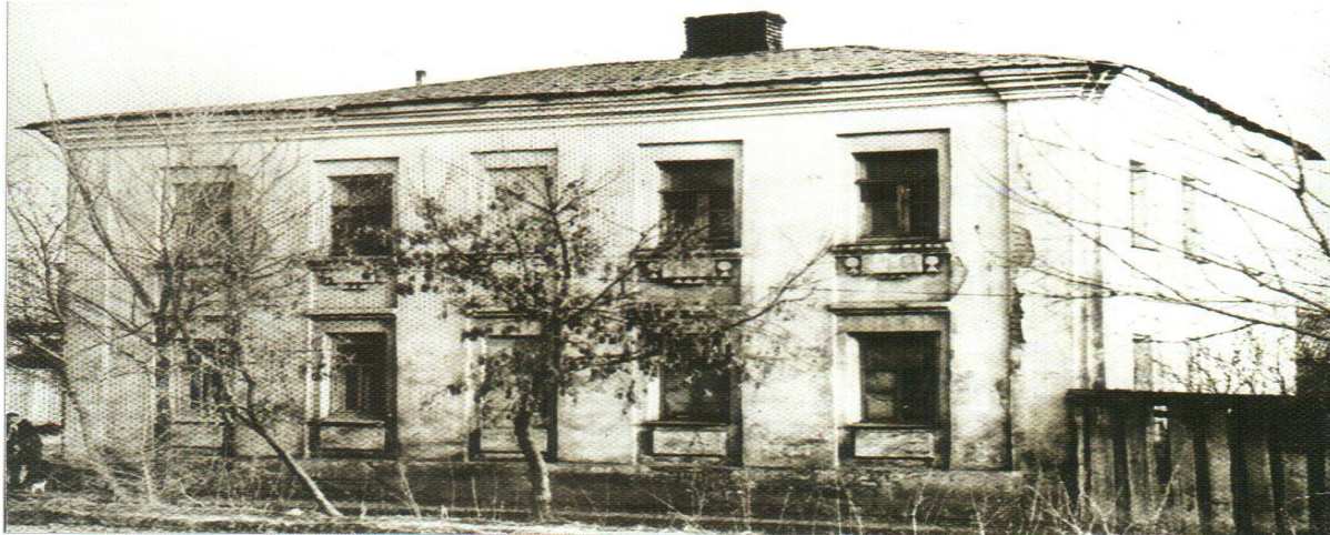
1895–1898 елларда Г.Тукай укыган өч сыйныфлы рус мәктәбе бинасы. 1960 еллардагы фоторәсем