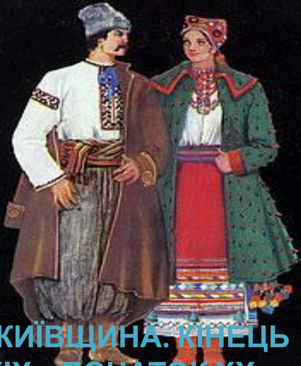
КИЇВЩИНА. КІНЕЦЬ XIX – ПОЧАТОК XX ст.