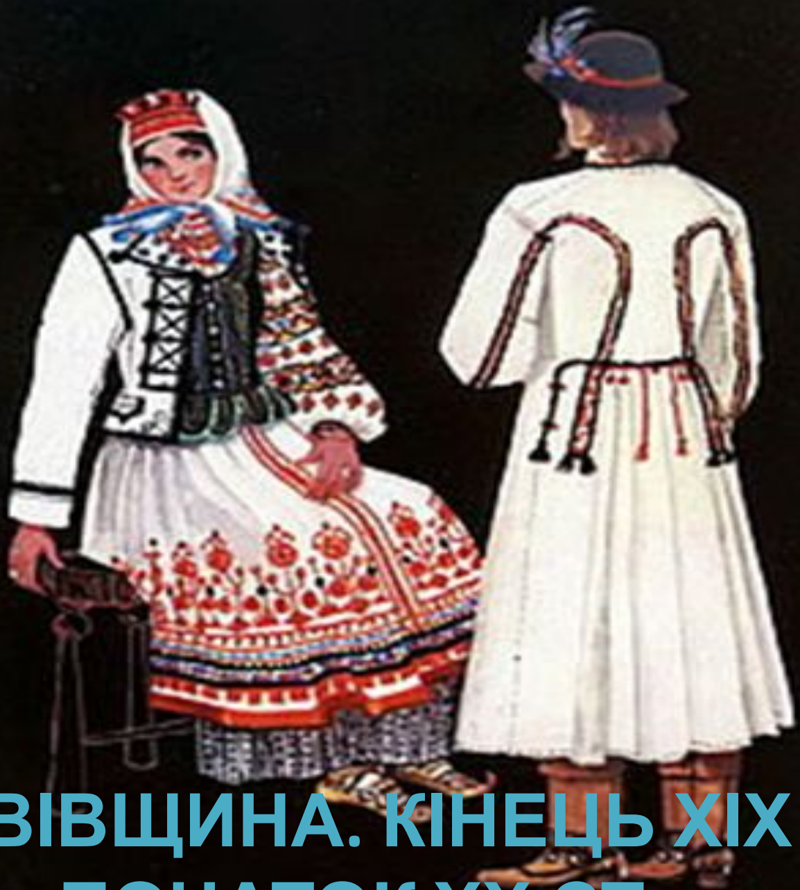
Львівщина. кінець XIX – початок XX ст.