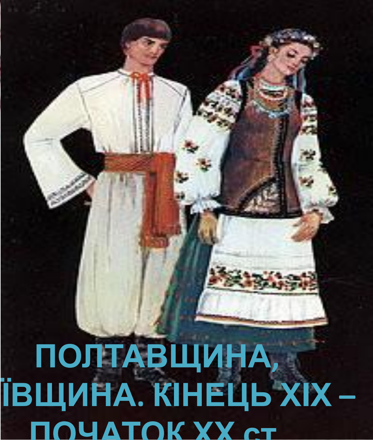
ПОЛТАВЩИНА, КИЇВЩИНА. КІНЕЦЬ ХІХ – ПОЧАТОК ХХ ст