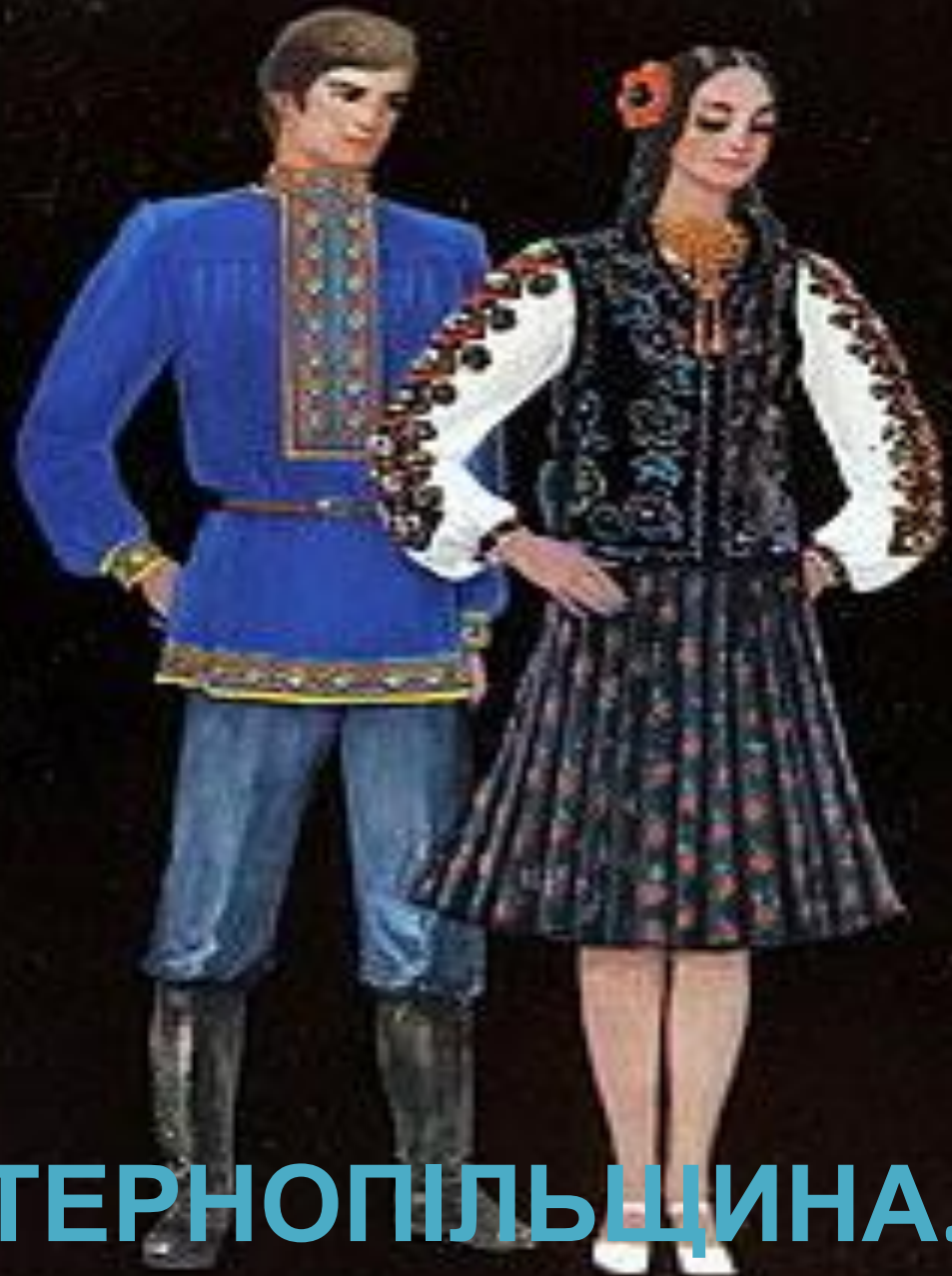
ТЕРНОПІЛЬЩИНА. 50-70 РР. XX ст.