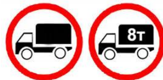
3.4 Движение грузовых автомобилей запрещено

Жолаушылар мен бағадды тасымалдау үшін пайдаланылатын көлік құралдары техникалық регламенттердің талаптарына сәйкес болуы тиіс.