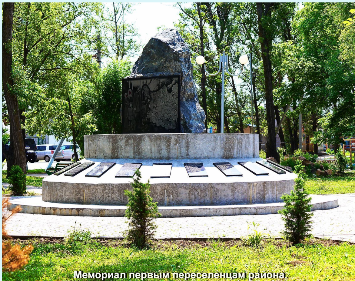
Мемориал первым переселенцам района