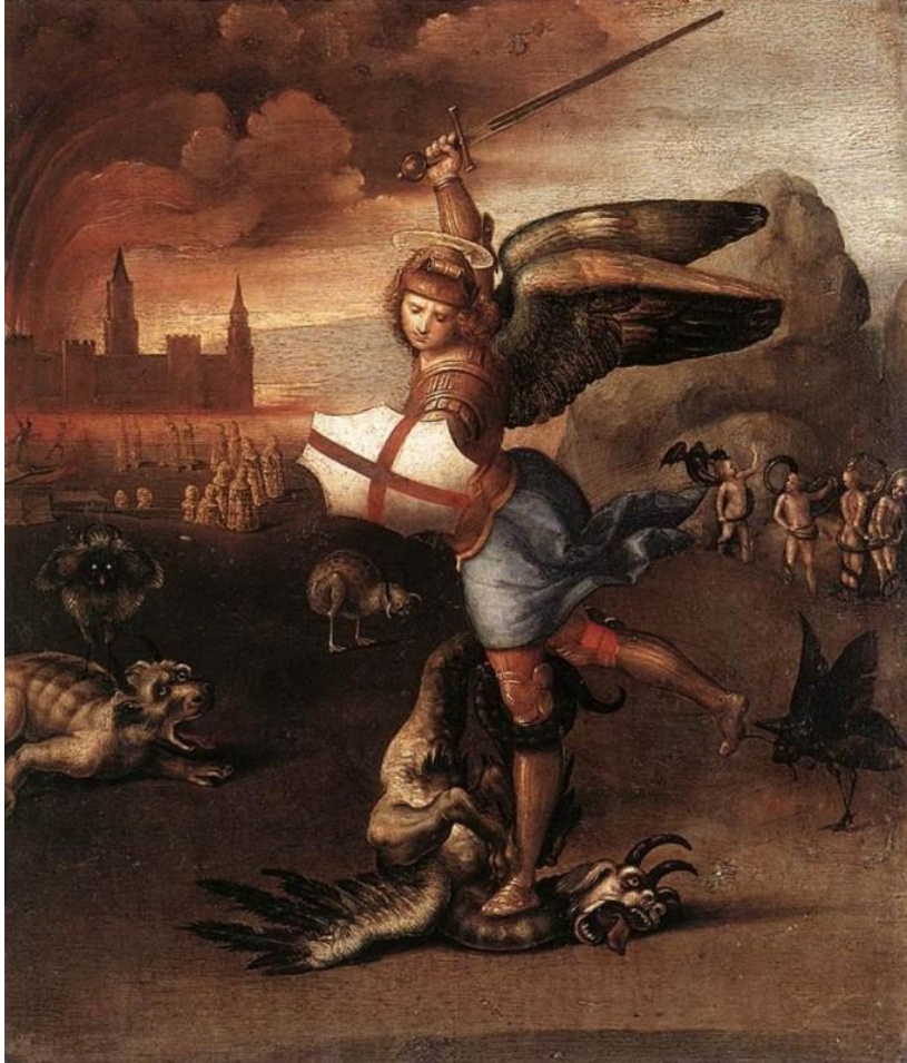
Рафаэль Санти «Святой Михаил и дракон»