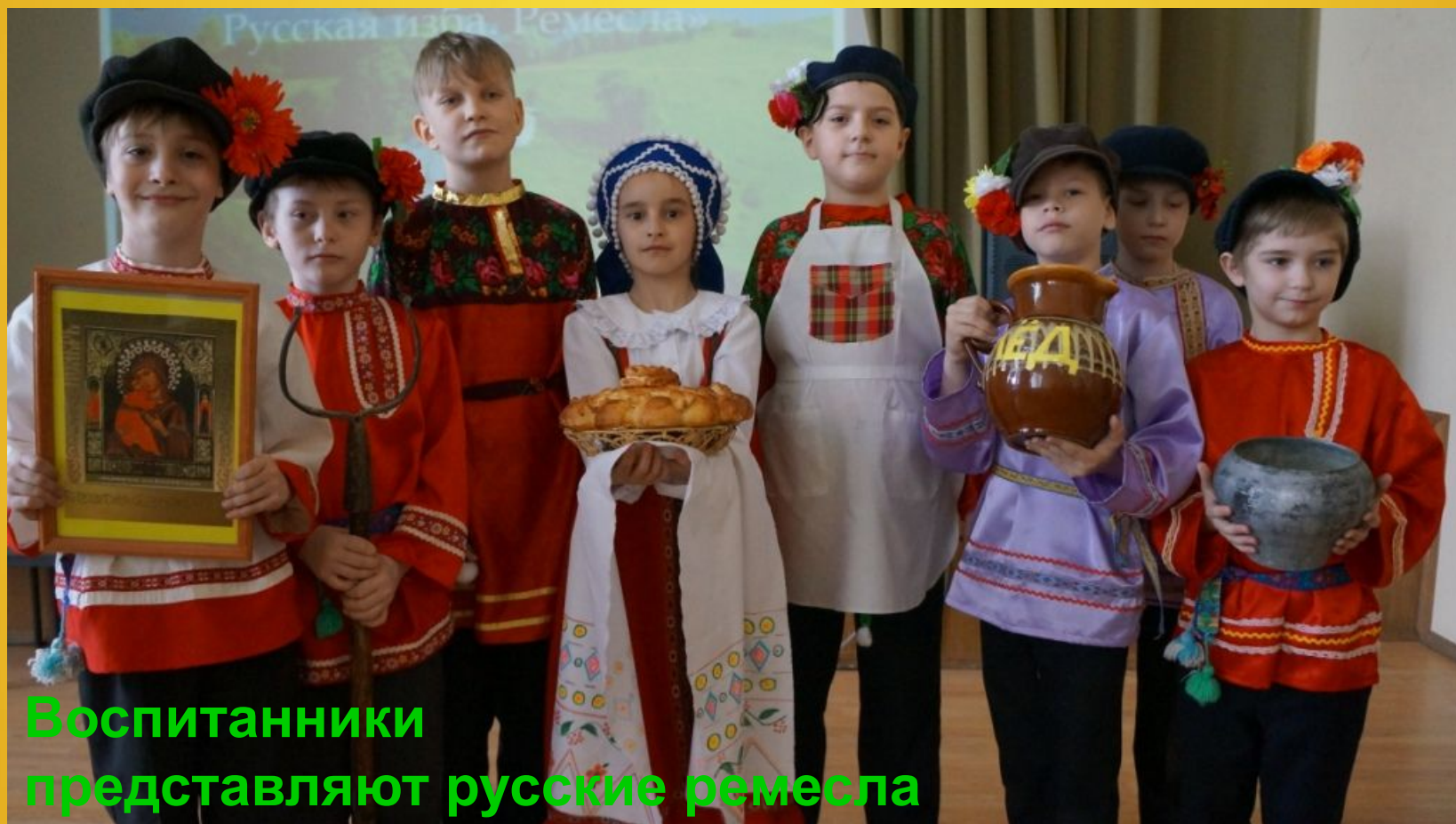
Воспитанники представляют русские ремесла