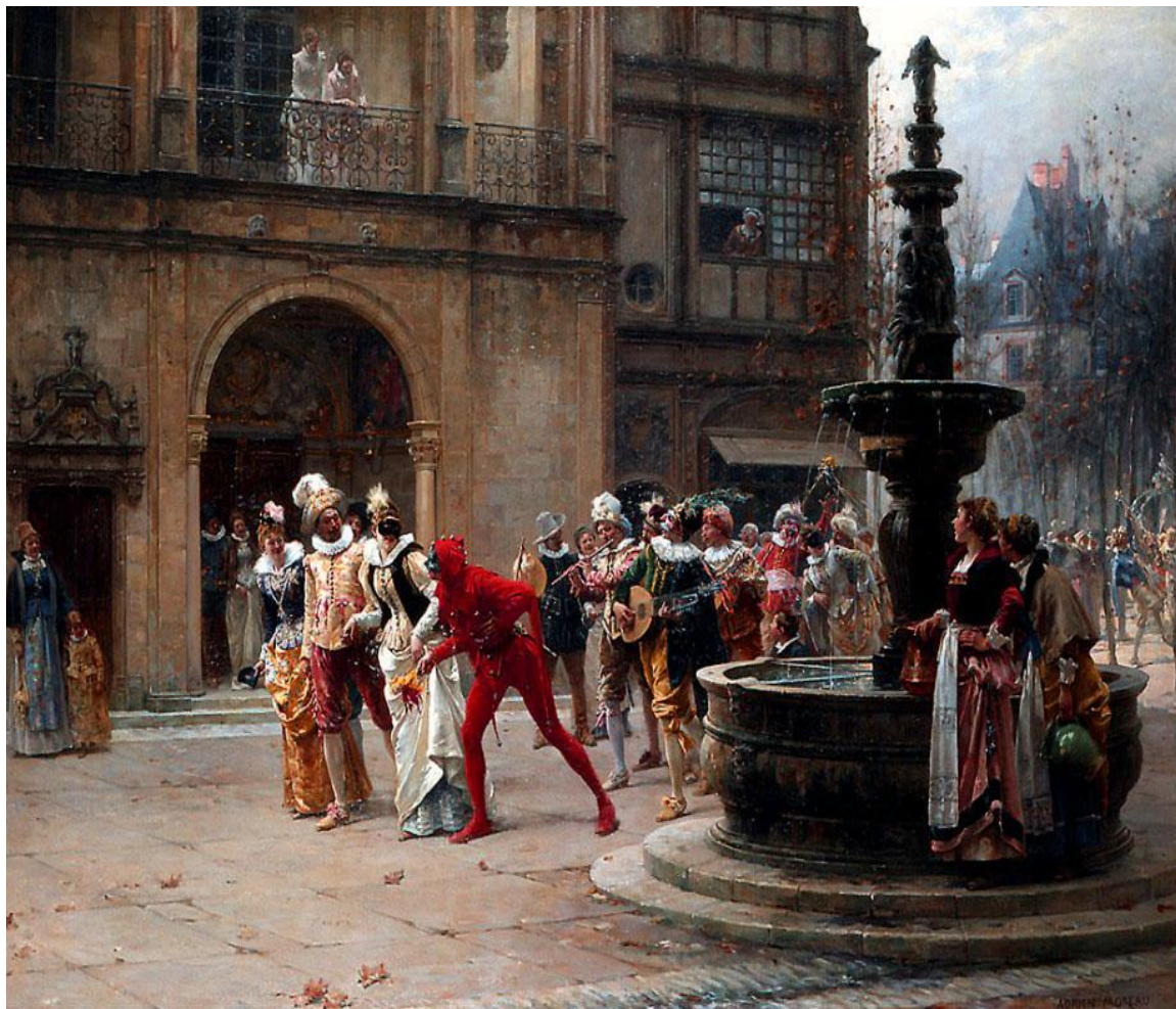
АДРИЕН МОРО. КАРНАВАЛЬНОЕ ШЕСТВИЕ В 17 ВЕКЕ.