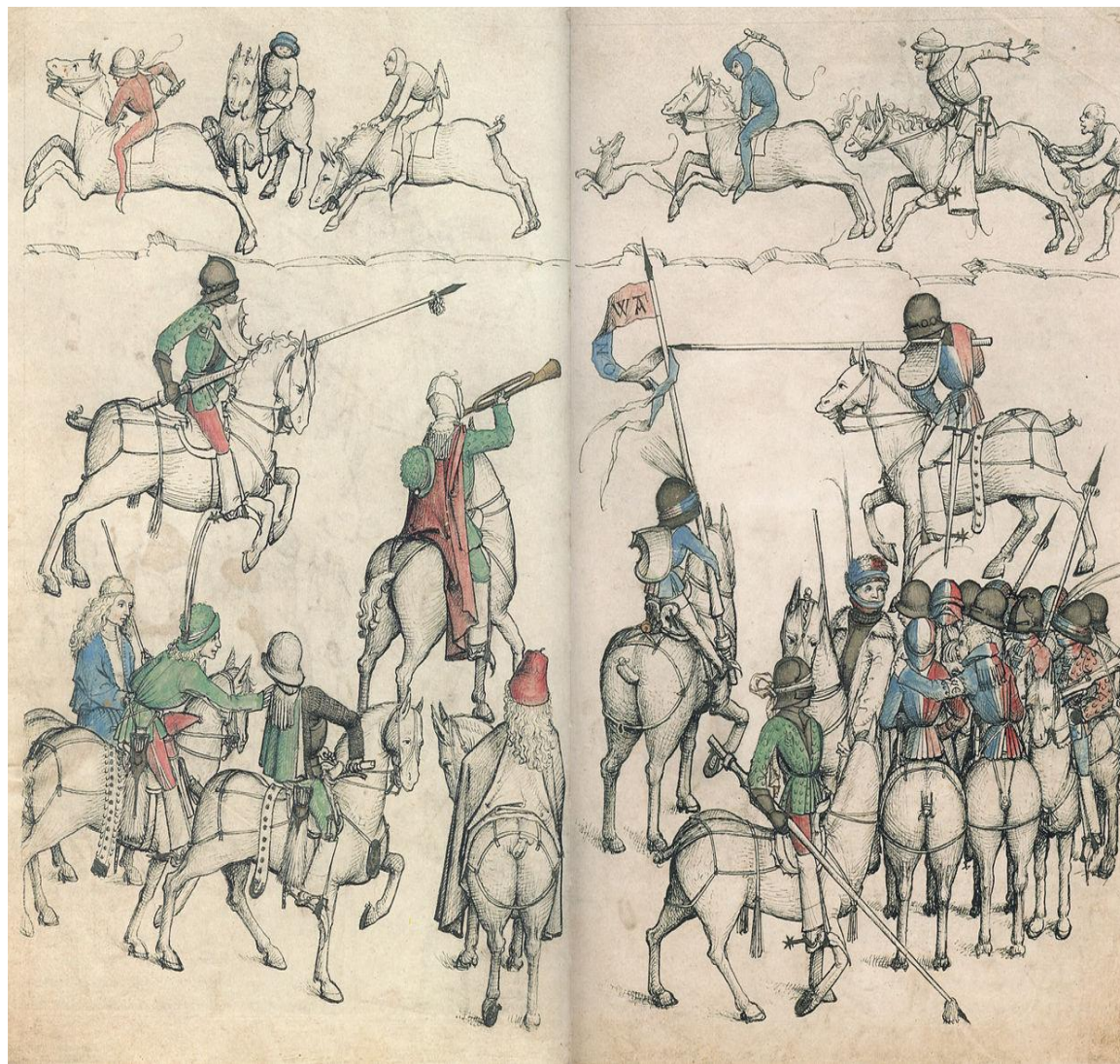
Рыцарский турнир. Иллюстрация из германской средневековой книги, 1480 год.