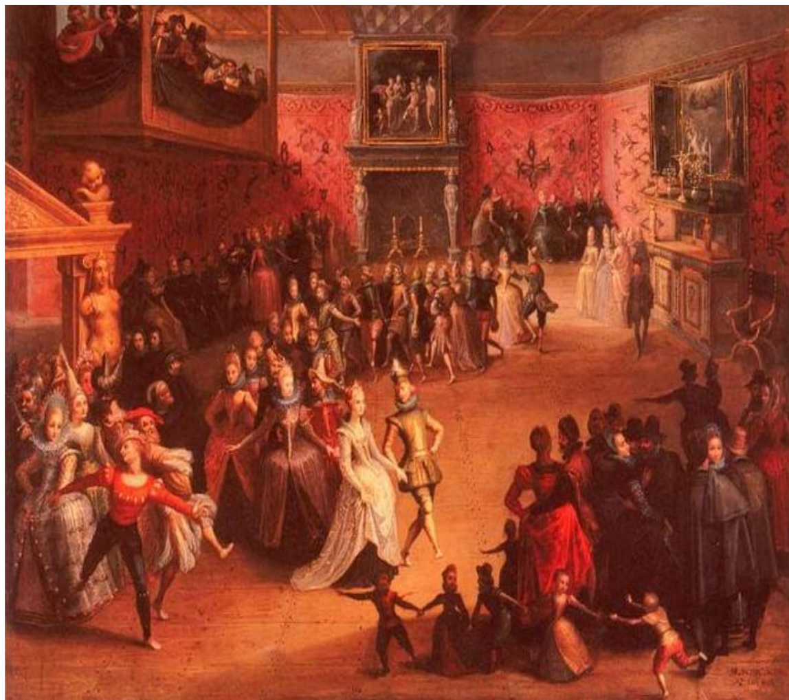
Мартин Шонгавер. Придворный бал.