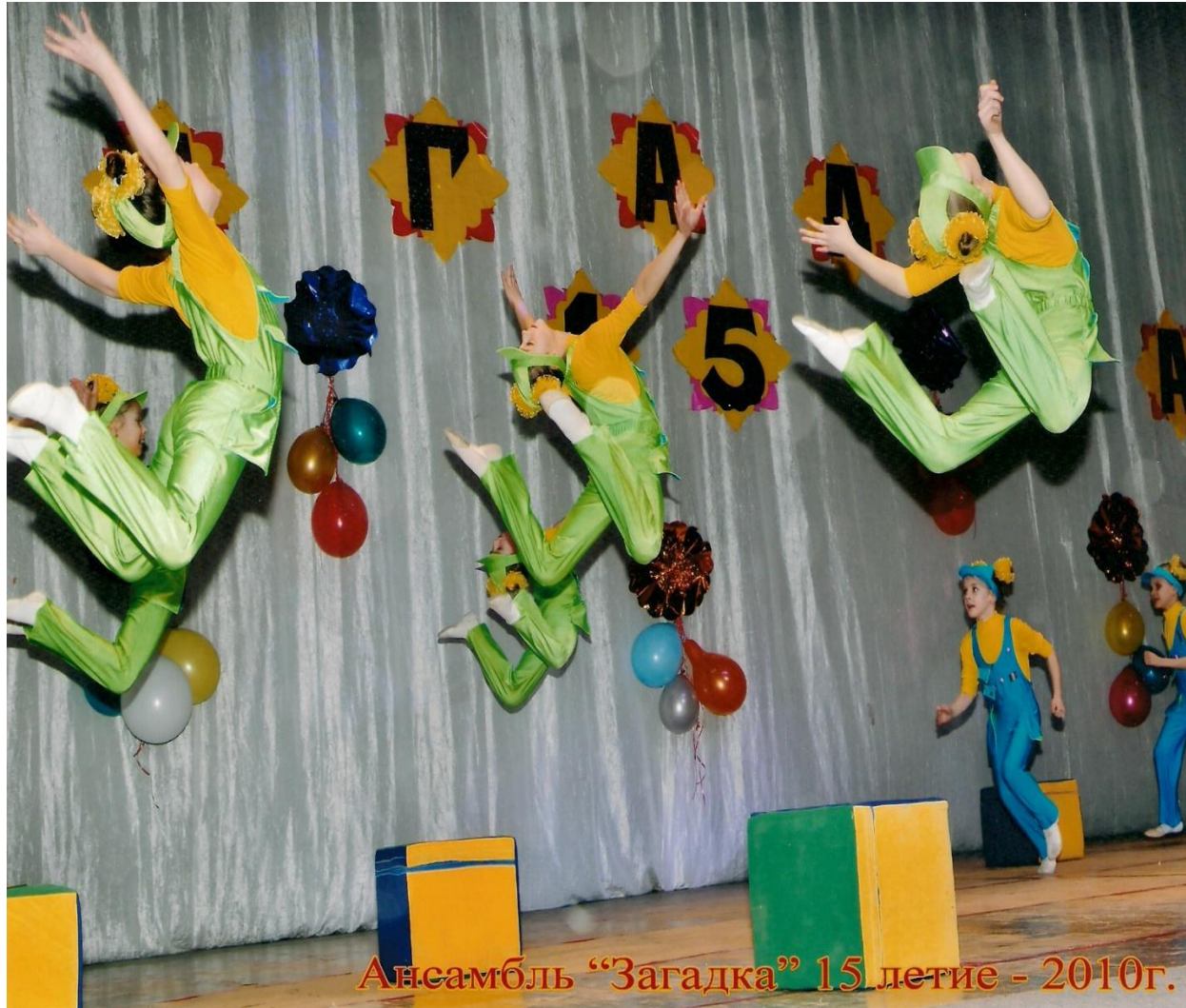
Ансамбль "Загадка" 15 летие - 2010г.