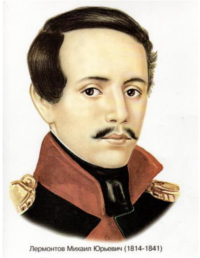
Лермонтов Михаил Юрьевич (1814-1841)