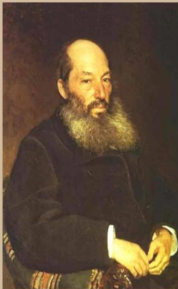
Афанасий Афанасьевич Фет