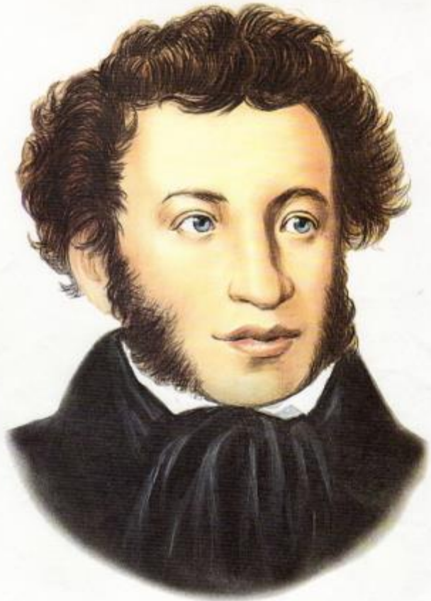
Пушкин Александр Сергеевич (1799-1837)