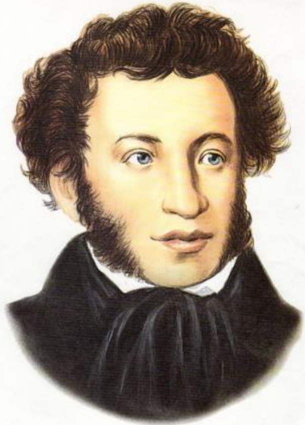
Пушкин Александр Сергеевич (1799-1837)