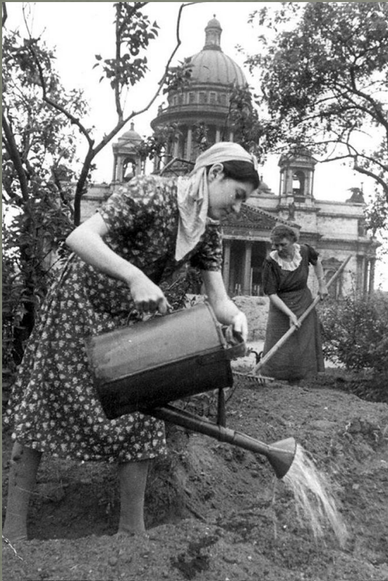
Женщины обрабатывают землю под огород на площади перед Исаакиевским собором в Ленинграде

Всего весной 1942 года было создано 633 подсобных хозяйства и 1468 объединений огородников, общий валовой сбор от совхозов, индивидуального огородничества и подсобных хозяйств за 1942 год составил 77 тыс. тонн.