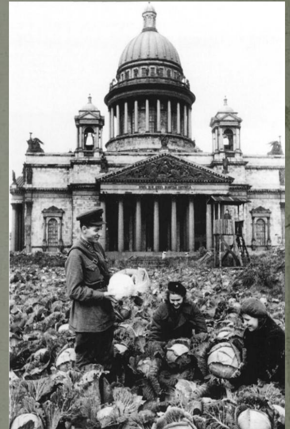
Сбор урожая капусты на площади перед Исаакиевским собором в 1942г.

Всего весной 1942 года было создано 633 подсобных хозяйства и 1468 объединений огородников, общий валовой сбор от совхозов, индивидуального огородничества и подсобных хозяйств за 1942 год составил 77 тыс. тонн.