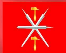
Флаг Тульской области

Герб Тулы был утверждён 8 марта 1778 года. На щите изображены оружие и золотые молоты, говорящие о том, что город славен производством оружия. «Все сие показывает примечания достойный и полезный оружейный завод, находящийся в сем городе».