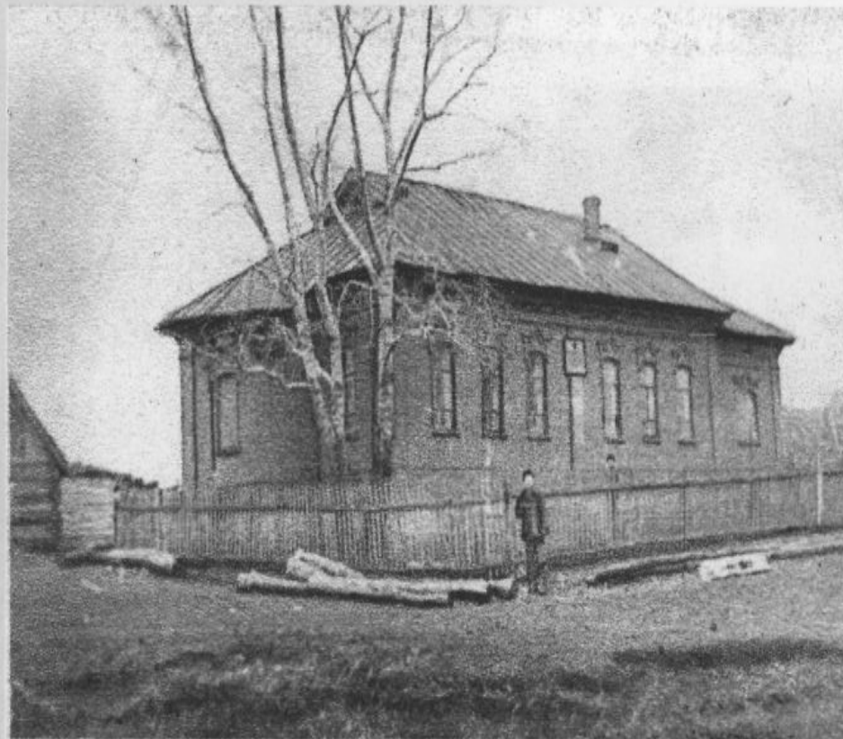
Башлангыч сыйныфларда Равил абыегыз укыган мөктәп. Балык Бистәсе районы, Балтач авылы.