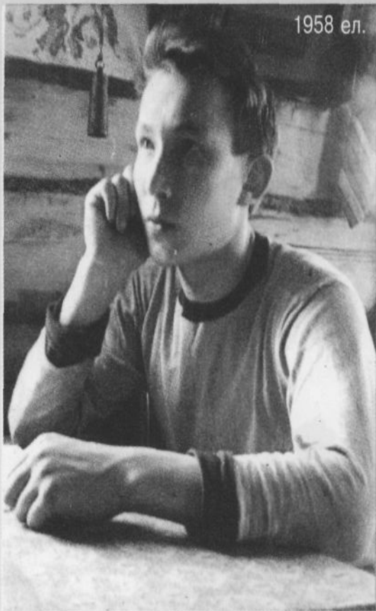
Максаты булган кеше – көчле кеше.