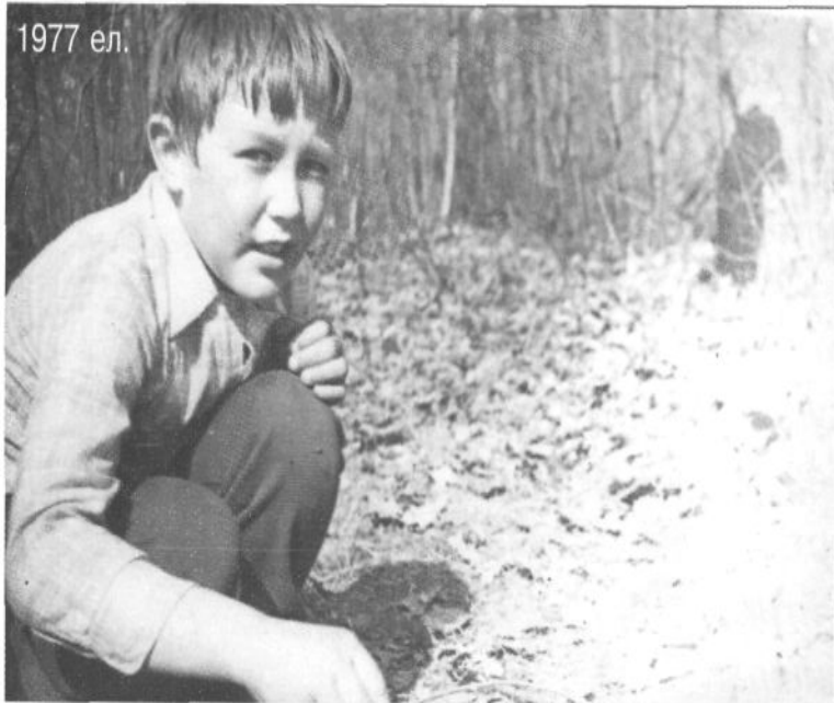
Аның Алмаз дигән нәни улы әлегә кырмыскалар көрәштерә.