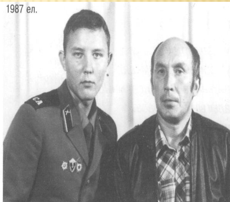
Менә ул да үсеп житте, солдат сафларына китте.