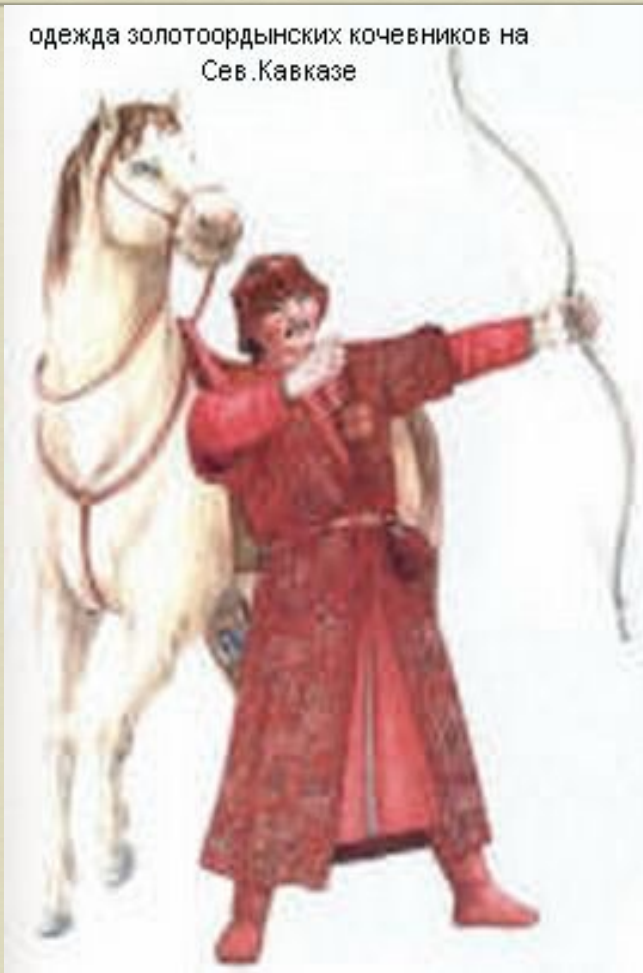
одежда золотоордынских кочевников на Сев. Кавказе