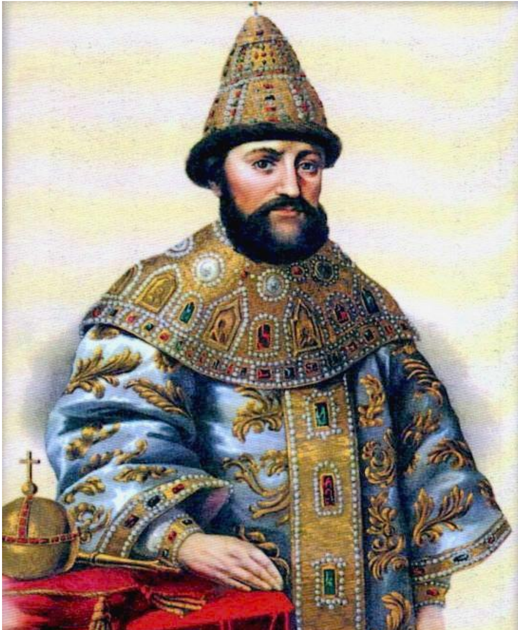
Михаил Фёдорович Романов (1613 – 1645)