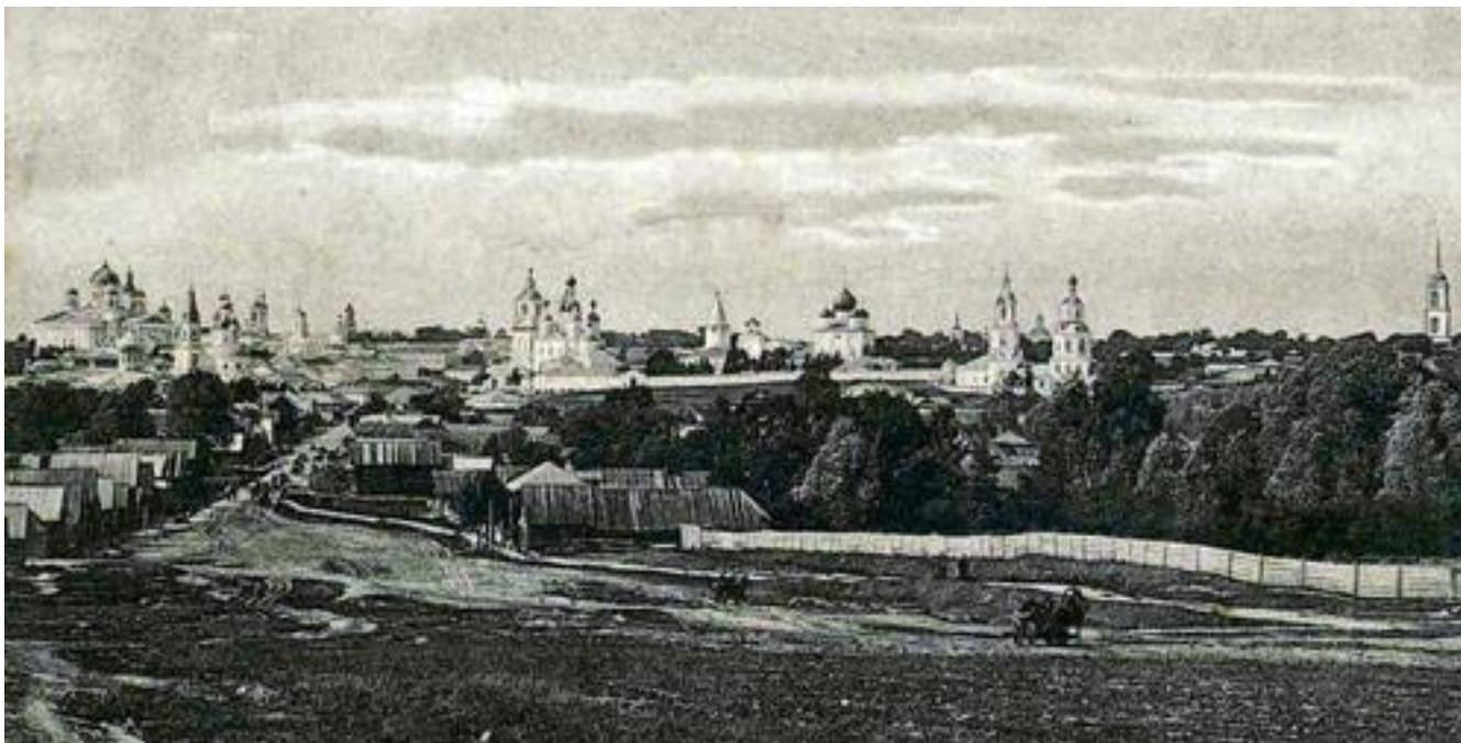
Арзамас в XVII-XVIII веке

На территории современной Нижегородской области находилось пять городов с уездами – Нижний Новгород, Балахна, Арзамас, Курмыш и Василь-город.