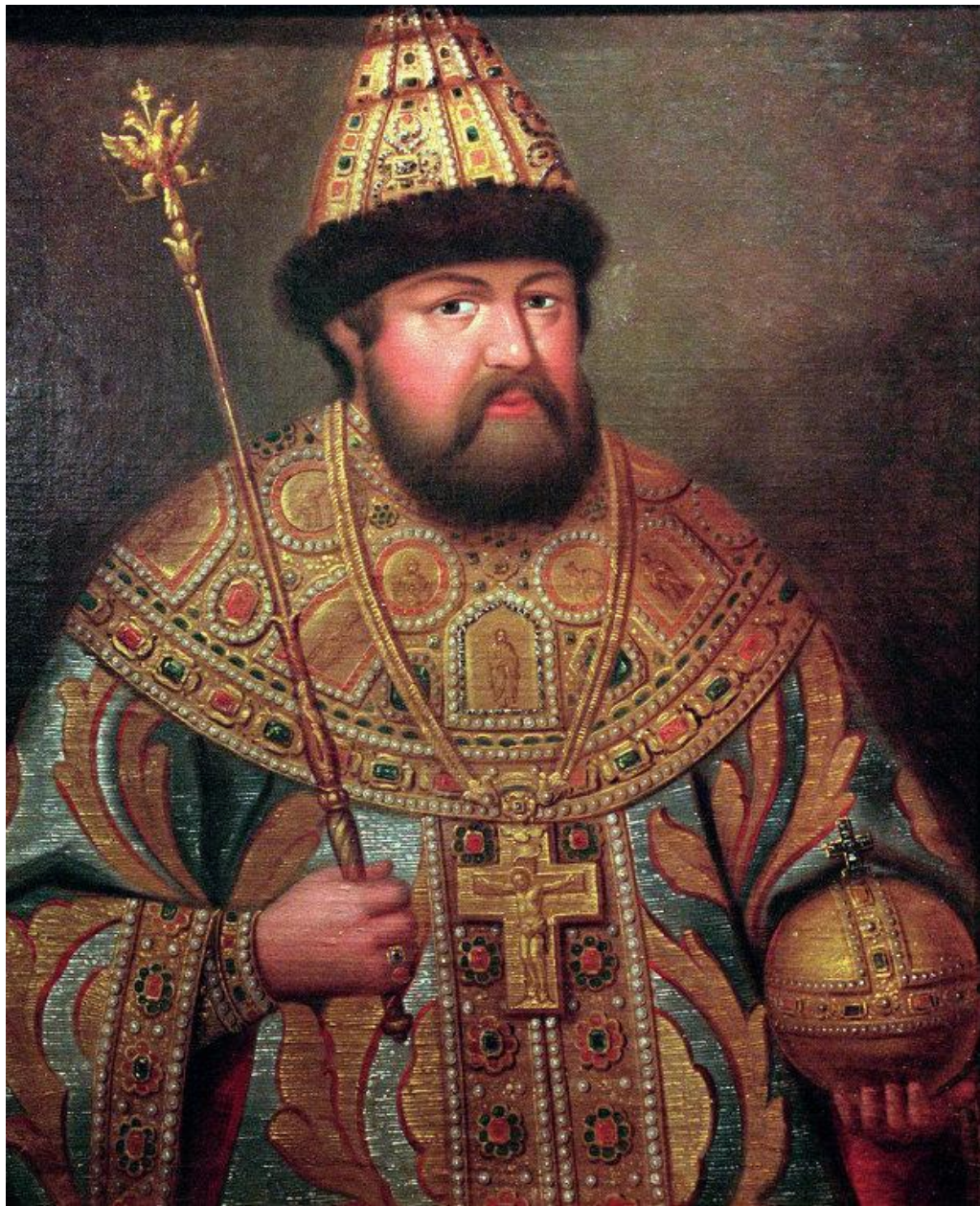
Алексей Михайлович Романов (1645 – 1676)