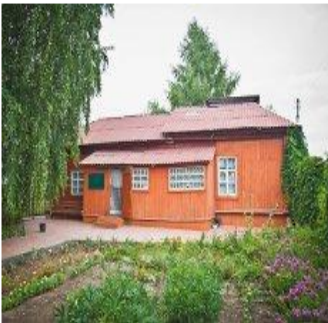
КОВЫЛКИНСКИЙ КРАЕВЕДЧЕСКИЙ МУЗЕЙ