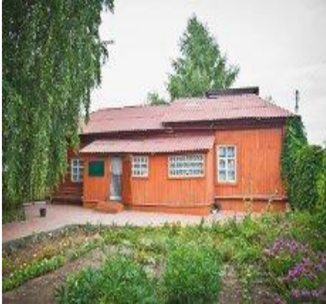
КОВЫЛКИНСКИЙ КРАЕВЕДЧЕСКИЙ МУЗЕЙ