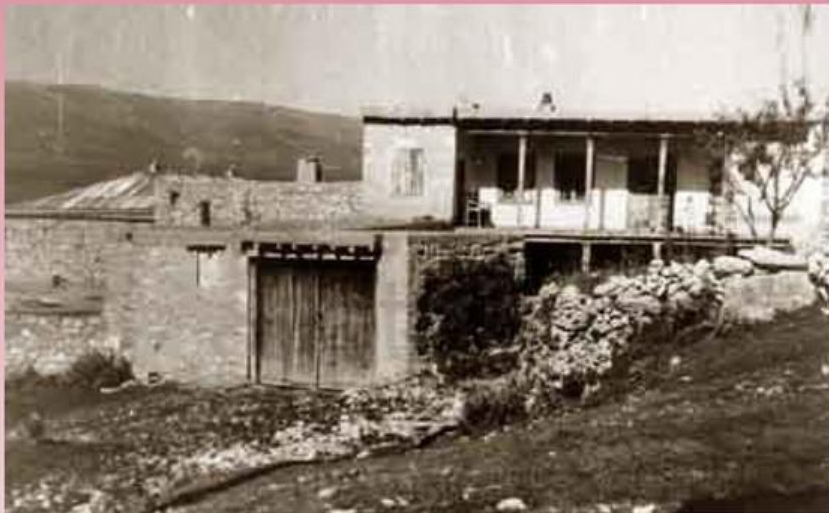
Ці адаса Х1 амзат жанив гьавураб ва гьес г1умру гьабун бук1араб мина