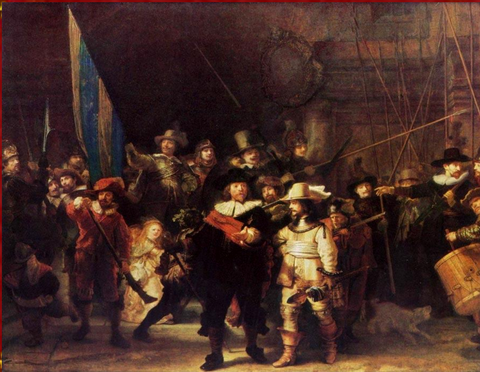
"Ночной дозор" 1642 Рейкс музей, Амстердам