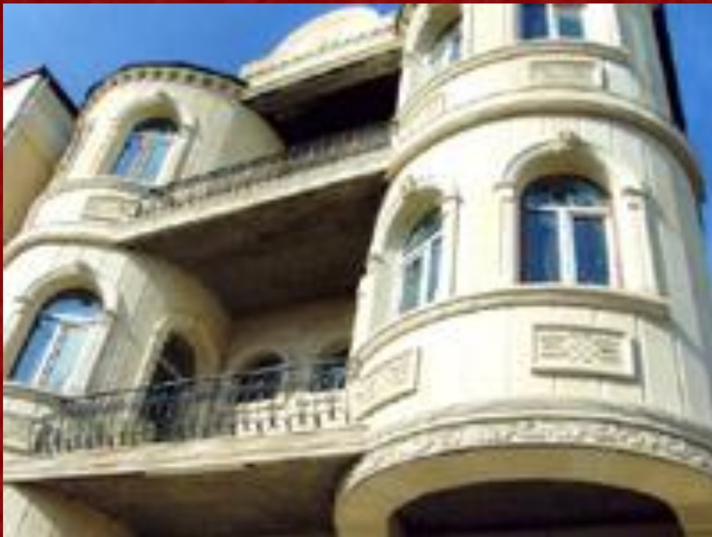
Лепнина на зданиях