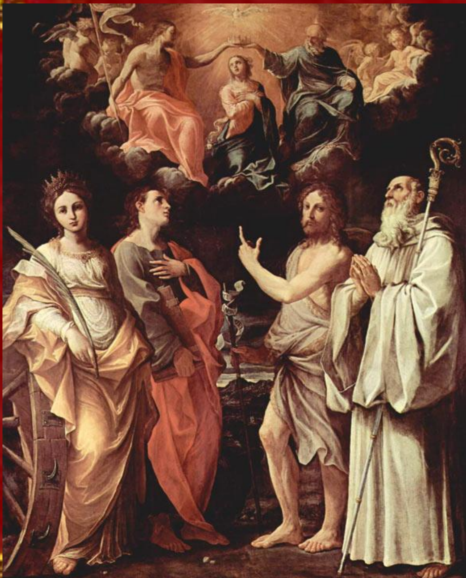
Коронование девы Марии, 1595-1598

У истоков традиции Барокко искусства в живописи стоят два великих итальянских художника - Караваджо и Аннибале Карраччи, создавшие самые значительные работы в последнее десятилетие 16 века - первое десятилетие 17 века. Для итальянской живописи конца 16 века характерны неестественность и стилевая неопределённость. Караваджо и Карраччи своим искусством вернули ей цельность и