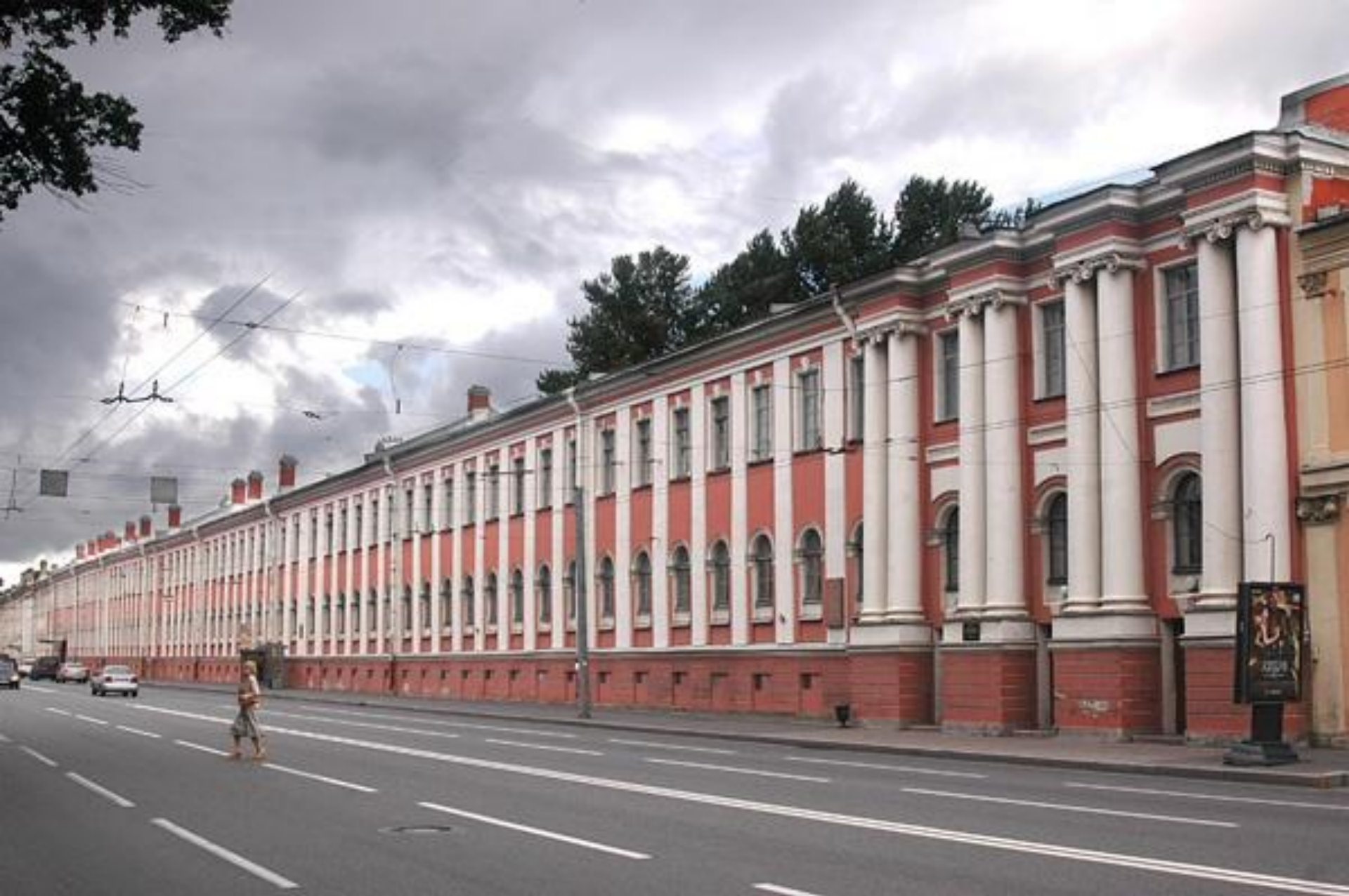
Архитекторы: Трезини Дж. Год постройки:1730-1740 Стиль: Барокко Здание Первого Кадетского корпуса