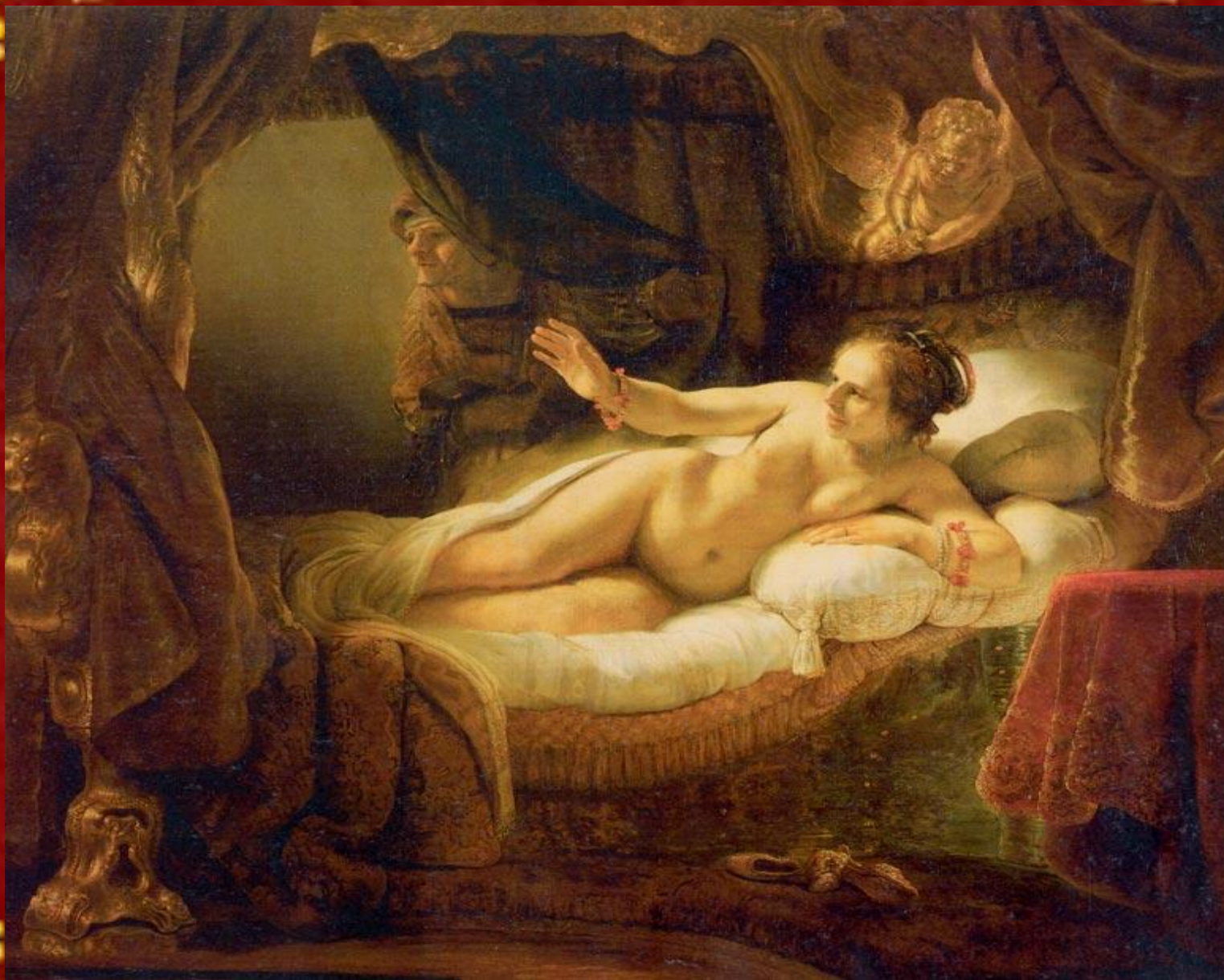
"Даная" 1636 Эрмитаж, Санкт-Петербург