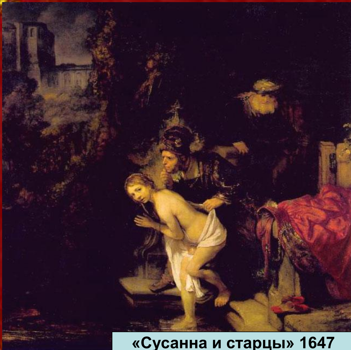
«Сусанна и старцы» 1647

Искусство барокко сложилось и расцвело в Италии, где работали крупнейший архитектор и скульптор Л. Бернини, живописец, глава демократического реализма Караваджо, последователи академизма братья Карраччи и др.