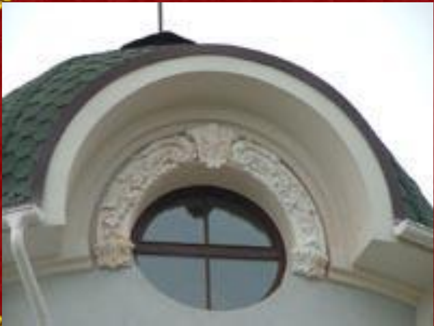
Лепнина на зданиях