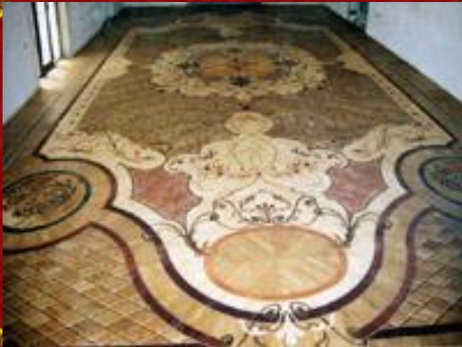
Паркет в стиле барокко