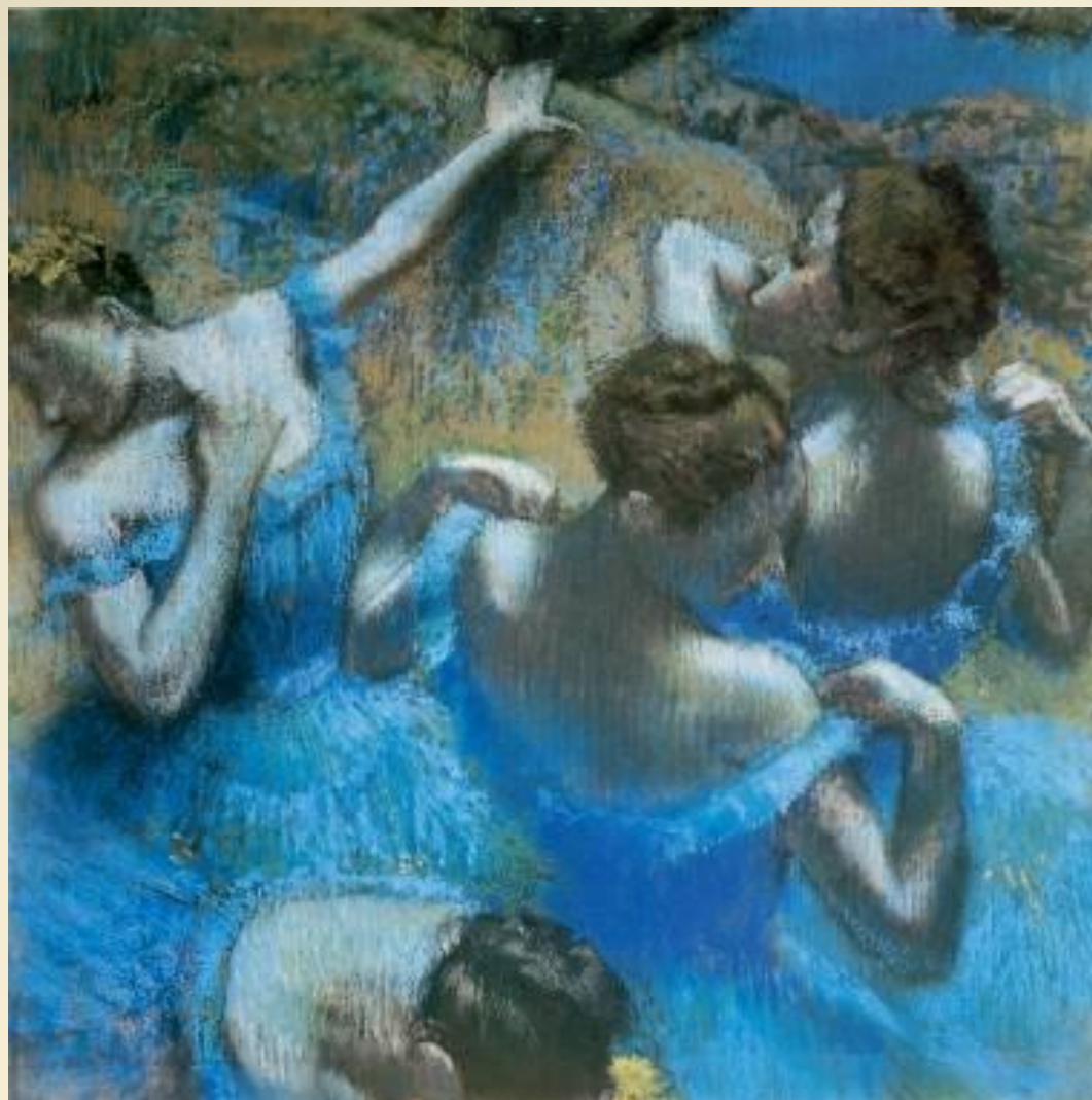
Голубые танцовщицы. Пастель

Эдгар Дега́ (19 июля 1834, Париж — 27 сентября 1917) — французский живописец, один из виднейших и оригинальных представителей импрессионистского движения.