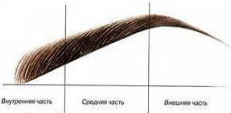
Рис. 1. Строение бровей