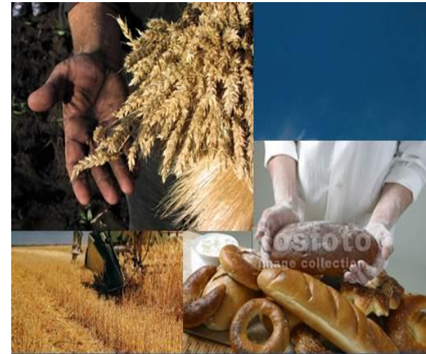
Золотые руки хлеборобов