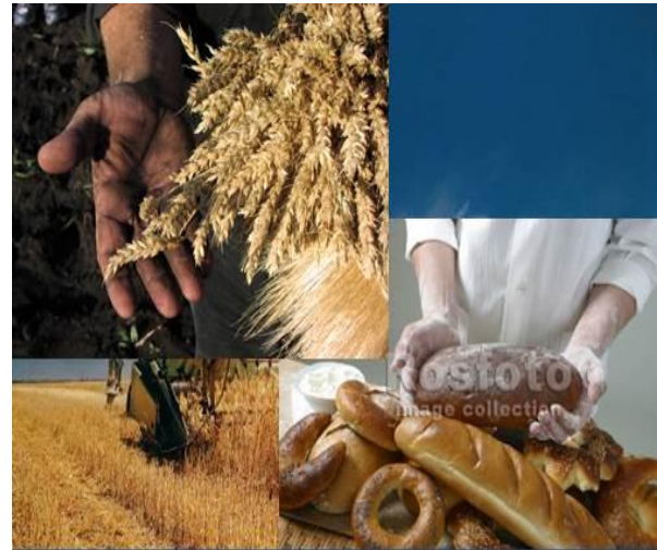
Золотые руки хлеборобов