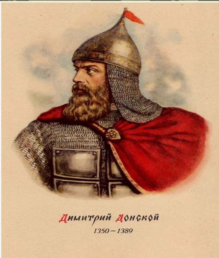
Димитрий Донской 1350-1389