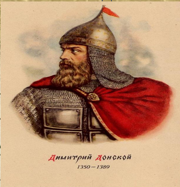
Димитрий Донской 1350 – 1389