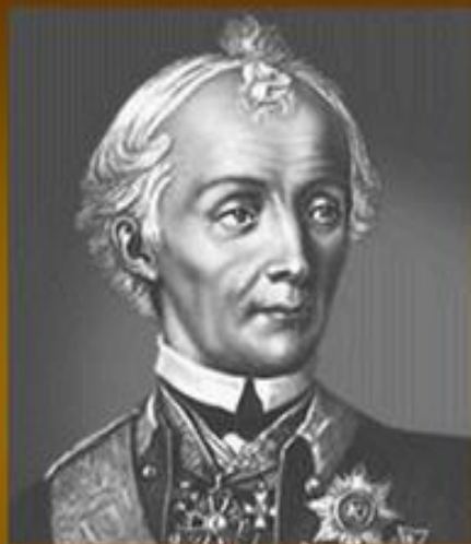
Суворов Александр Васильевич