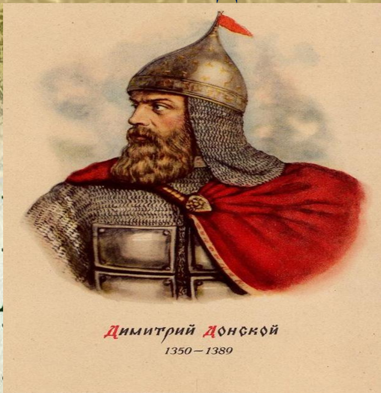
Димитрий Донской 1350 – 1389