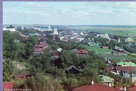
Город Владимир – отец русских городов

Что-то высшее Осталось Нам в подарок от времён Заглушают пересуды Правда, времени и честь Белокаменное чудо, Бело-памятная весть. И совсем с другого бока Подступая к высоте, Отрекаемся от бога, А приходим К красоте. Не разгаданы узоры Этой каменной резьбы... Смолкают наговоры Еременчивой судьбы.