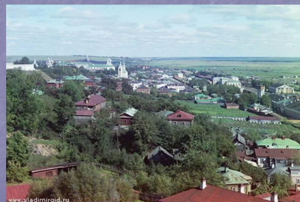
Город Владимир – отец русских городов

Что-то высшее Осталось Нам в подарок от времён Заглушают пересуды Правда, времени и честь Белокаменное чудо, Бело-памятная весть. И совсем с другого бока Подступая к высоте, Отрекаемся от бога, А приходим К красоте. Не разгаданы узоры Этой каменной резьбы... Смолкают наговоры Еременчивой судьбы.