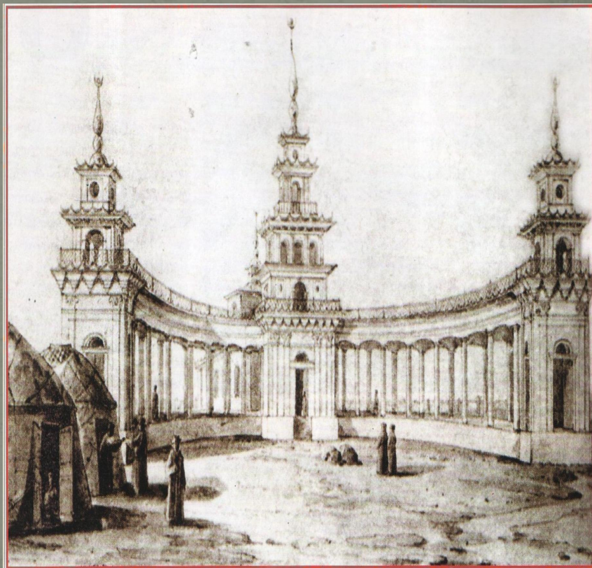
Н. Г. Чернецов. Главное сюзэ Хошеутовского хурула. 1838 г.