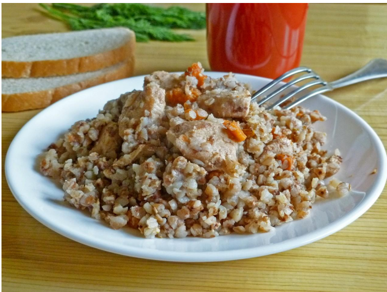
Гречневая каша с мясом