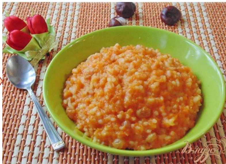
Тыквенная каша с рисом