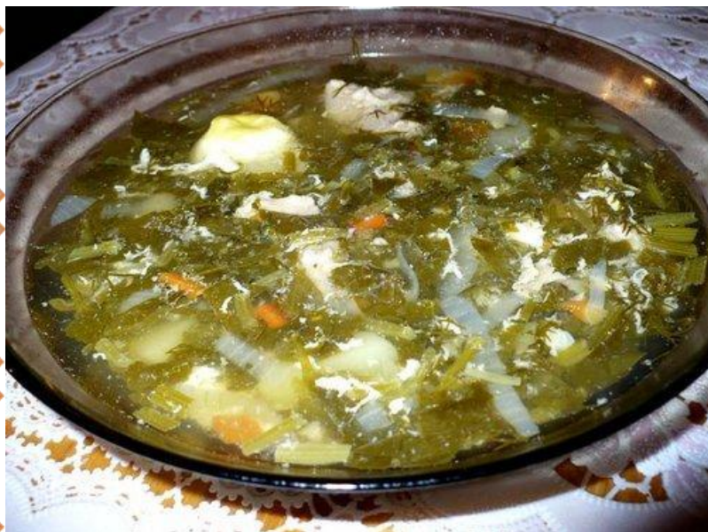
Суп из борщевика