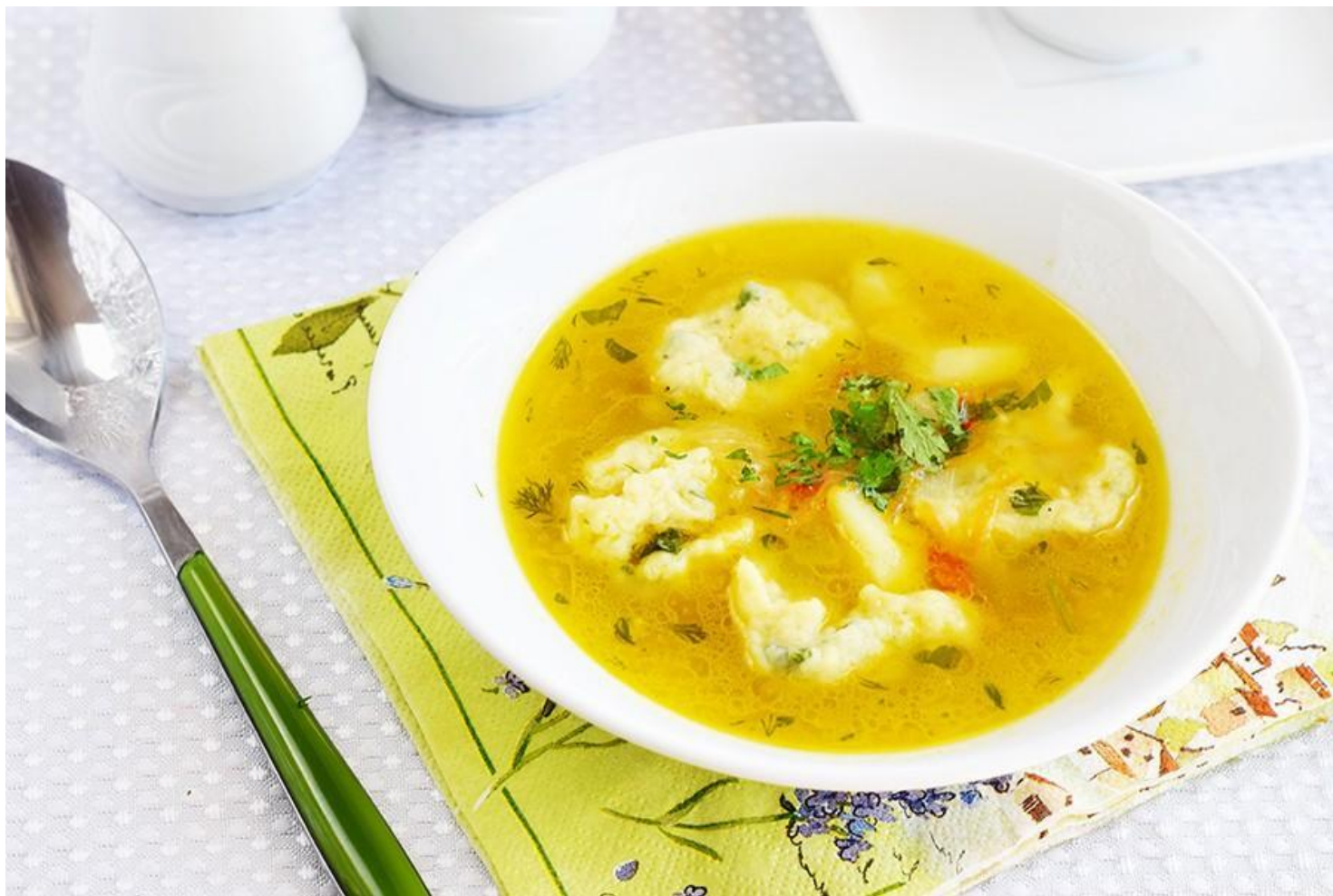
Шопо лашка (суп с кислым тестом)