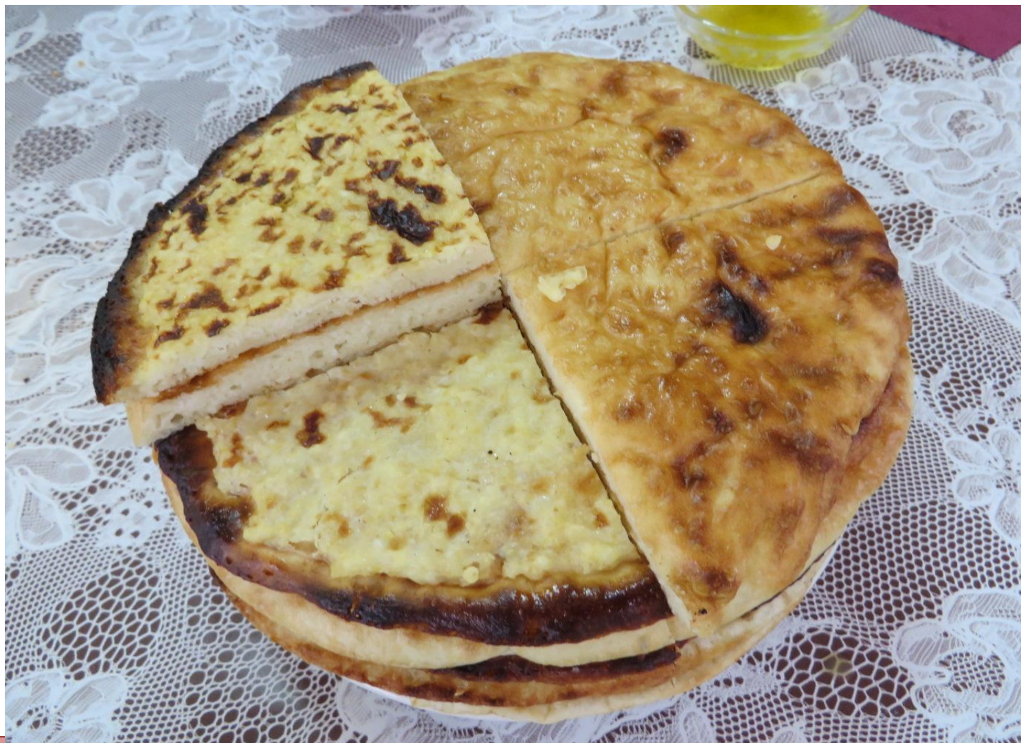
Команмелна (трёхслойный блин)