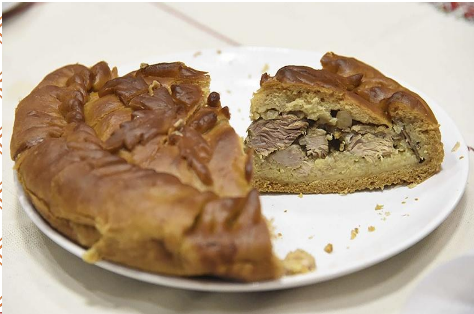
Кыравец (пирог с мясом и крупой)