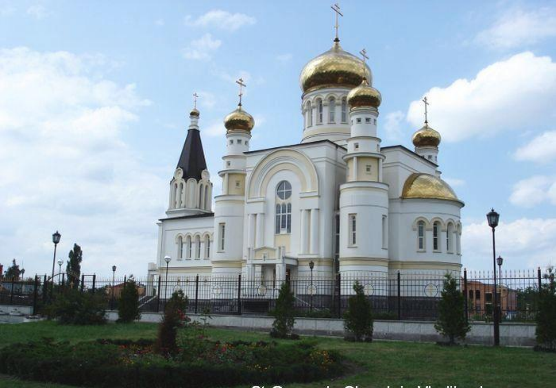
St. George's Church in Vladikavkaz