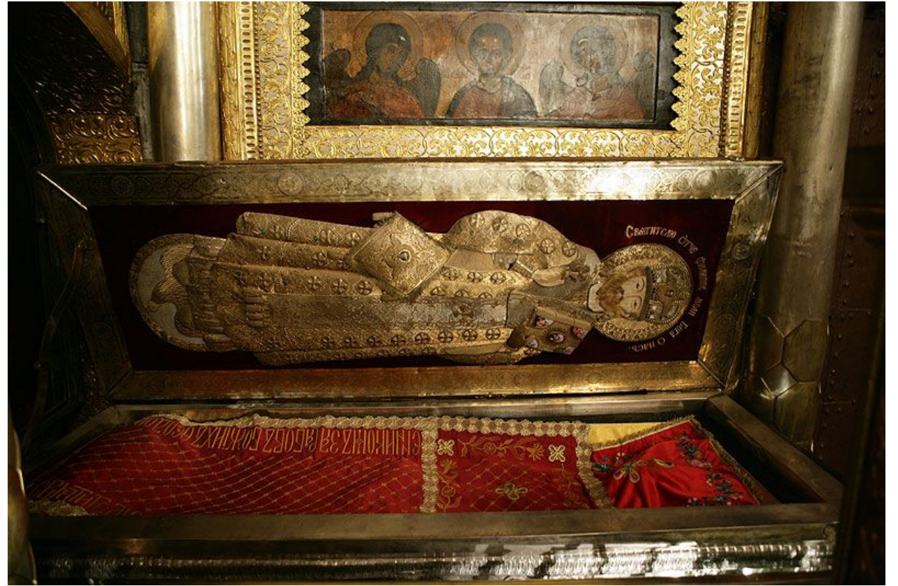
Рака с мощами святителя Филиппа