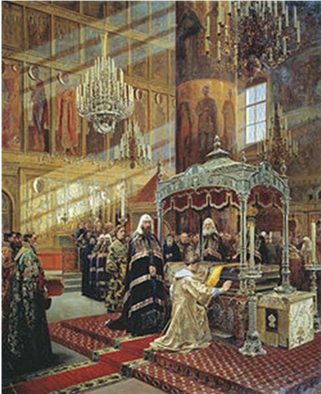
Алексей Михайлович и патриарх Никон перед гробницей святителя Филиппа