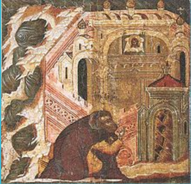
Фёдор у стен Соловецкого монастыря.

В возрасте 26 лет Федор начинает служить при царском дворе, однако боярский бунт привел к опале рода Колычевых, и юноша был вынужден покинуть Москву. Испытывая тягу к монашеской жизни, он отправляется на север Руси, в Соловецкий монастырь, где проводит некоторое время послушником, а потом принимает постриг с именем Филипп. Спустя несколько лет он был избран игуменом обители, и за время его управления было сделано множество хозяйственных нововведений: построены каналы между Соловецкими островами, мельницы и другие промышленные и хозяйственные строения.