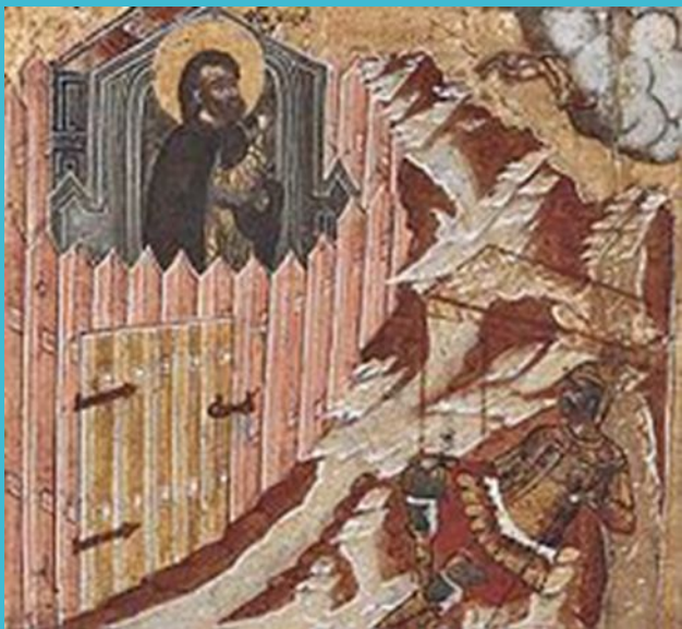
Святитель Филипп в заточении

По окончании богослужения он подошел к святителю Филиппу, желая получить благословение, но митрополит отказал ему в этом, произнеся обличительную речь. Подобные столкновения повторялись еще несколько раз, вызывая гнев и недовольство царя, и по его повелению состоялся церковный суд, на котором митрополит был оклеветан, его обвиняли в колдовстве, а также в нарушении церковных канонов во время игуменства в Соловецком монастыре. По этим клеветническим наветам он был приговорен к лишению сана и заключению в одном из московских монастырей.