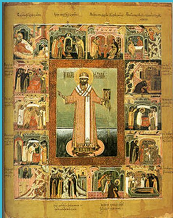
Святитель Филипп (житийная икона конца XVII века)

Память святителя Филиппа Московского совершается в Русской Православной Церкви несколько раз в году: 22 января, 13 июня и 16 июля по новому стилю, а также в дни Соборов Московских и Тверских святых.