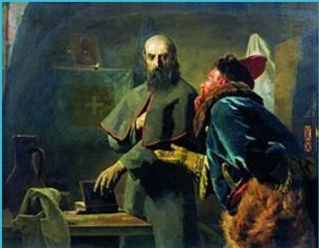
Николай Неврев «Митрополит Филипп и Малюта Скуратов». 1898 год.

Однако народ очень любил своего митрополита, неоднократно заступавшегося за неугодных царю и опальных людей, и потому возле места заточения святителя ежедневно собирались толпы народа, желавшие хоть мельком увидеть своего пастыря и заступника. Из-за этого царь повелел отправить митрополита Филиппа в Тверской Отрочь монастырь. Спустя год обитель посетил известный опричник Малюта Скуратов, прося от имени царя благословения на поход в Новгород. Целью этого похода было жестокое подавление бунта недовольных царем жителей города.