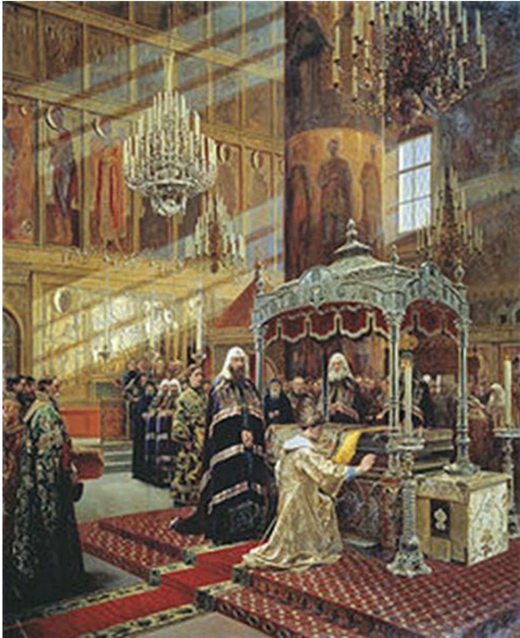
Алексей Михайлович и патриарх Никон перед гробницей святого Филиппа