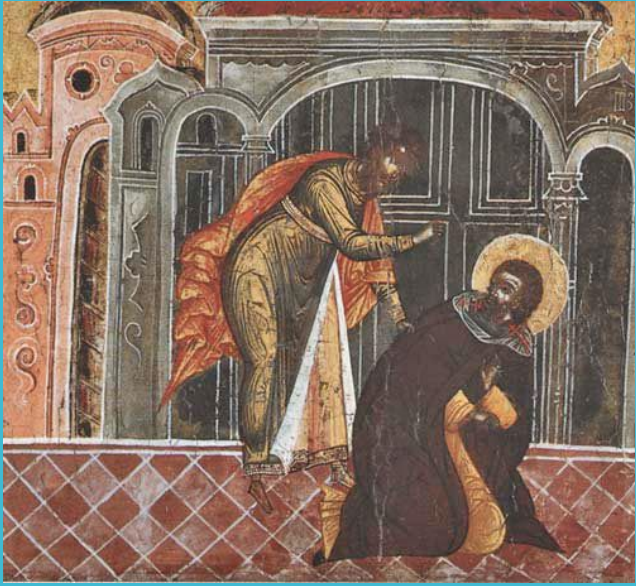
Убийство митрополита Филиппа

Святитель, предвидя новое кровопролитие, отказался благословлять поход и был задушен опричником. Святителя погребли в Отроче монастыре, а позже его останки были перенесены в Соловецкий монастырь, где он пользовался особым почитанием и любовью. В 1652 году по повелению царя Алексея Михайловича мощи святителя были с почетом перенесены в Москву, где патриарх Никон прочитал над ними грамоту, в которой от лица царя и всего народа приносил покаяние и просил прощения у святителя за нечестивые дела предков.