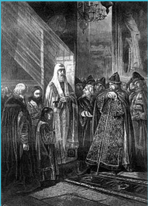
Митрополит Филипп отказывается благословить Ивана Грозного

В 1551 году игумен Филипп посетил Москву для участия в Стоглавом соборе. Образованный и деятельный инок произвел большое впечатление на царя Ивана IV, и, когда в 1566 году встал вопрос об избрании нового митрополита, он вспомнил о Филиппе и пожелал видеть его первосвященником Русской Церкви. Долгое время Филипп не соглашался принять на себя такой высокий сан и условием своего поставления в митрополиты ставил отмену опричнины. Царь не дал на это согласия, но пообещал, что митрополит будет его советником и помощником в делах управления, и тогда Филипп согласился.