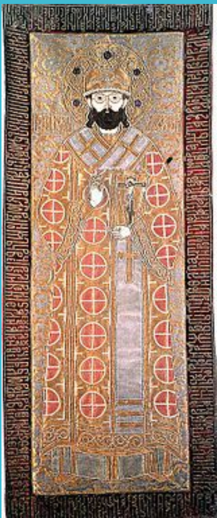
Святитель Филипп (покров на раку, 1650 год)

Посвящая много времени благоустройению вверенного ему монастыря, игумен Филипп не забывал о том, что главной целью монашеской жизни является духовное возрастание и служение Богу и потому часто удалялся для молитвы в небольшую пустынь, расположенную неподалеку. Там игумен был удостоен видения Господа, явившегося ему в терновом венце, как бы указывая на предстоящий мученический подвиг святителя. В этом месте начал бить родник, над которым позже поставили часовню.