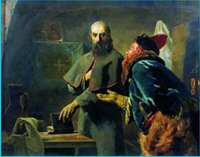
Николай Неврев «Митрополит Филипп и Малюта Скуратов». 1898 год.

Однако народ очень любил своего митрополита, неоднократно заступавшегося за неугодных царю и опальных людей, и потому возле места заточения святителя ежедневно собирались толпы народа, желавшие хоть мельком увидеть своего пастыря и заступника. Из-за этого царь повелел отправить митрополита Филиппа в Тверской Отрочь монастырь. Спустя год обитель посетил известный опричник Малюта Скуратов, прося от имени царя благословения на поход в Новгород. Целью этого похода было жестокое подавление бунта недовольных царем жителей города.