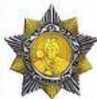
Орден Богдана Хмельницкого I, II и III степени

Учрежден в октябре 1943 г. для награждения рядового, начальствующего состава, офицеров и генералов Красной Армии, ВМФ, руководителей партизанских отрядов. За годы войны орденом I степени произведено 373 награждения, II степени – 2396, III степени – 5738 награждений.