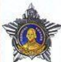
Орден Ушакова I и II степени

Учрежден в марте 1943 г. Награждались офицеры Военно-Морского Флота за выдающиеся заслуги в организации и обеспечении боевых операций. За годы войны орденом I степени произведено 47 награждений, II степени – 114 награждений.