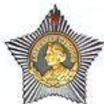
Орден Суворова I, II и III степени

Учрежден в июне 1942 г. Награждались офицеры и генералы Красной Армии за выдающиеся успехи в деле управления войсками. За годы войны орденом I степени произведено 391 награждение, II степени – 2861, III степени – 4952 награждений.