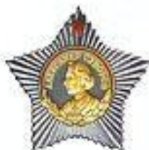
Орден Суворова I, II и III степени

Учрежден в июне 1942 г. Награждались офицеры и генералы Красной Армии за выдающиеся успехи в деле управления войсками. За годы войны орденом I степени произведено 391 награждение, II степени – 2861, III степени – 4952 награждений.