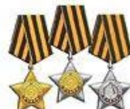
Орден Славы I, II и III степени

Учрежден в мае 1943 г. Награждались им рядового и начальствующего состава Красной Армии, ВМФ и партизанских отрядов. За годы войны орденом I степени награждены 325 тыс. человек, II степени – 1 млн 28 тыс. человек.