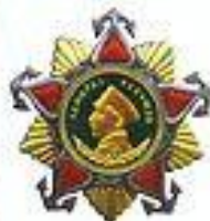
Орден Нахимова I и II степени

Учрежден в марте 1944 г. Награждались офицеры Военно-Морского Флота за выдающиеся заслуги в руководстве и обеспечении боевых операций. За годы войны орденом I степени произведено 82 награждения, II степени – 469 награждений.