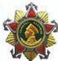
Орден Нахимова I и II степени

Учрежден в марте 1944 г. Награждались офицеры Военно-Морского Флота за выдающиеся заслуги в руководстве и обеспечении боевых операций. За годы войны орденом I степени произведено 82 награждения, II степени – 469 награждений.