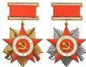
Орден Отечественной войны I и II степени

Учрежден в мае 1943 г. Награждались им рядового и начальствующего состава Красной Армии, ВМФ и партизанских отрядов. За годы войны орденом I степени награждены 325 тыс. человек, II степени – 1 млн 28 тыс. человек.