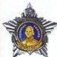
Орден Ушакова I и II степени

Учрежден в марте 1943 г. Награждались офицеры Военно-Морского Флота за выдающиеся заслуги в организации и обеспечении боевых операций. За годы войны орденом I степени произведено 47 награждений, II степени – 114 награждений.