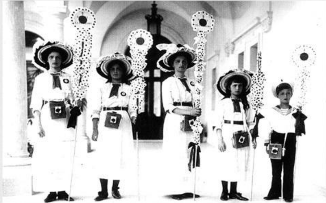
Дети Императора Николая II в День Белого цветка: Татьяна, Мария, Ольга, Анастасия, Алексей. Ливадия, 20 апреля 1912 г.