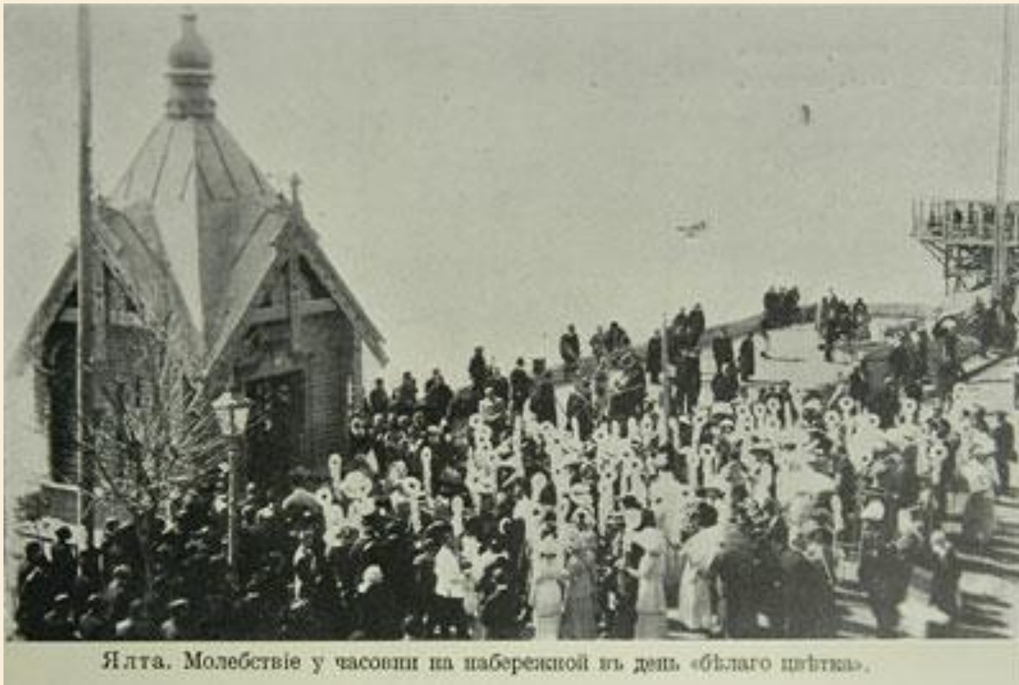
Ялта. Молебствіе у часовни на набережной въ день «блага шѣтка».