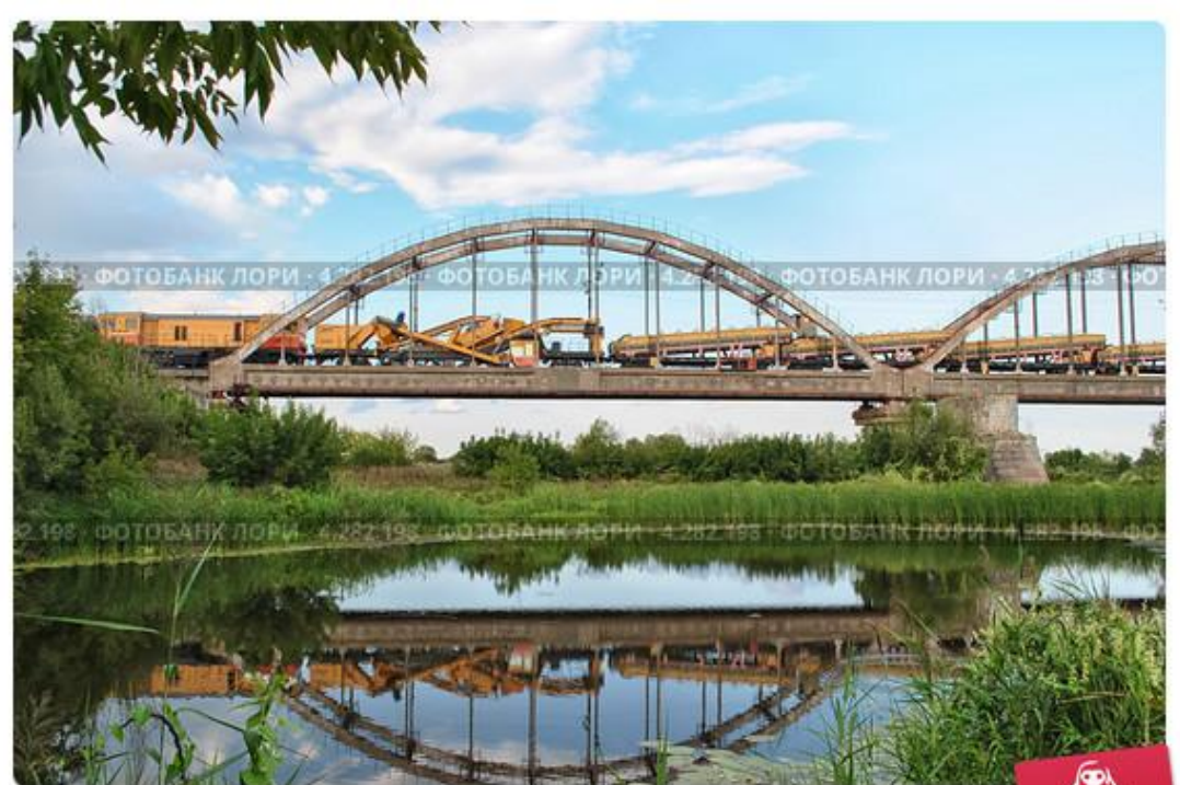
Железнодорожный мост, Моршанск, поезд, сельхозтехника