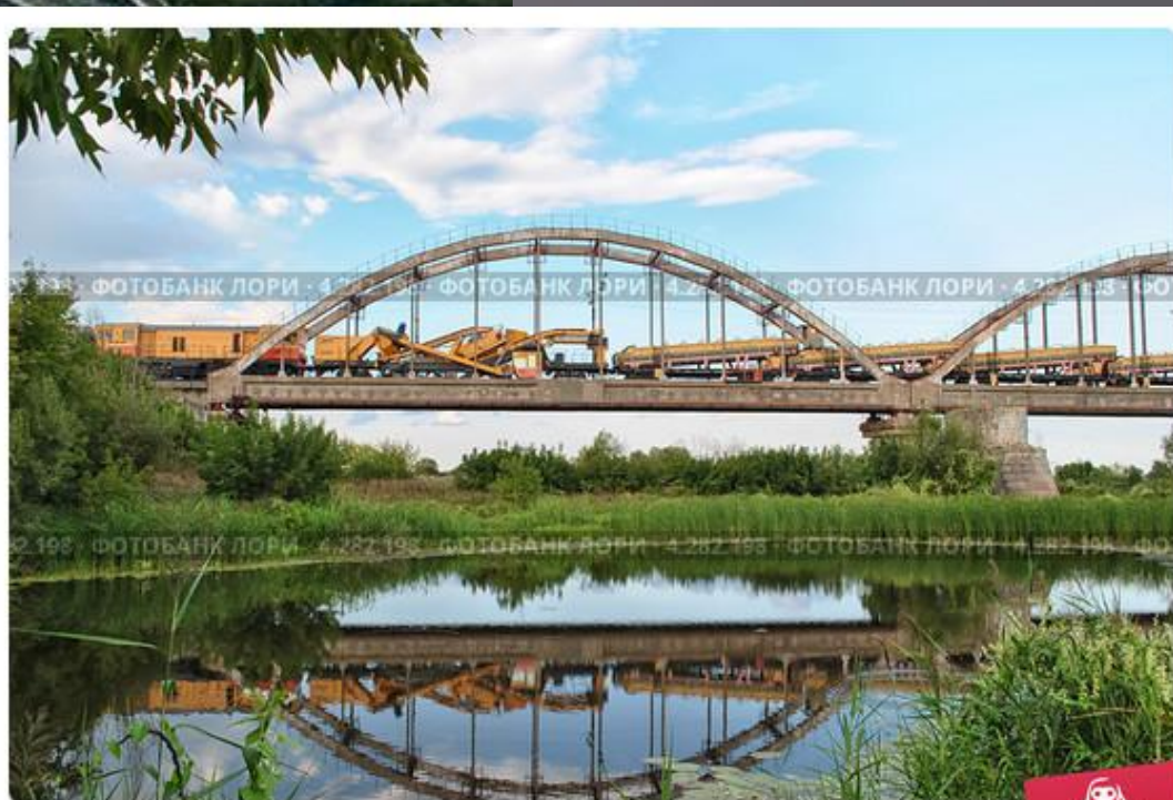
Железнодорожный мост, Моршанск, поезд, сельхозтехника