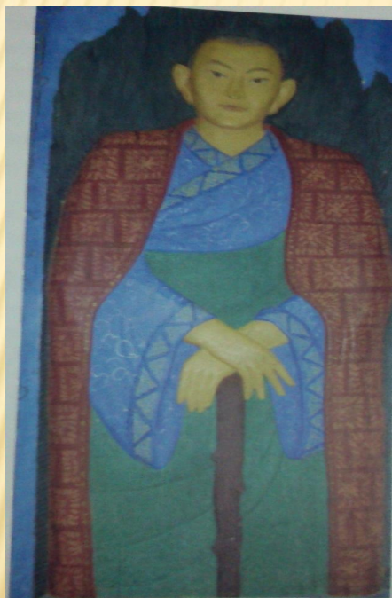
Зая-пандита — основатель ойратской калмыцкой письменности. Образ, созданный заслуженным художником РСФСР Владимиром Васькиным. 1971. Национальный музей Республики